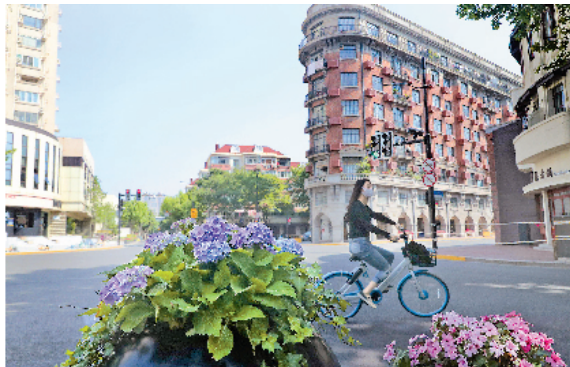
5月17日,市民骑车从上海武康大楼前经过。