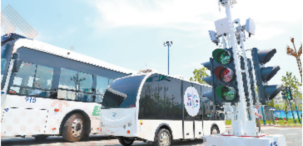
德清布局发展车联网产业