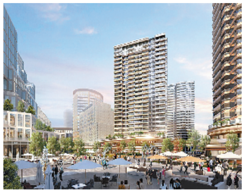
设计师笔下的新世界·城市艺术中心发展示意图

国有所需,民有所呼,企有所应。改革开放之初,新世界就积极投身国家发展建设,数十年来,初心不改。在新时代,新世界中国地产有限公司已经把社会责任作为自身谋求高质量发展、为社会奉献物质