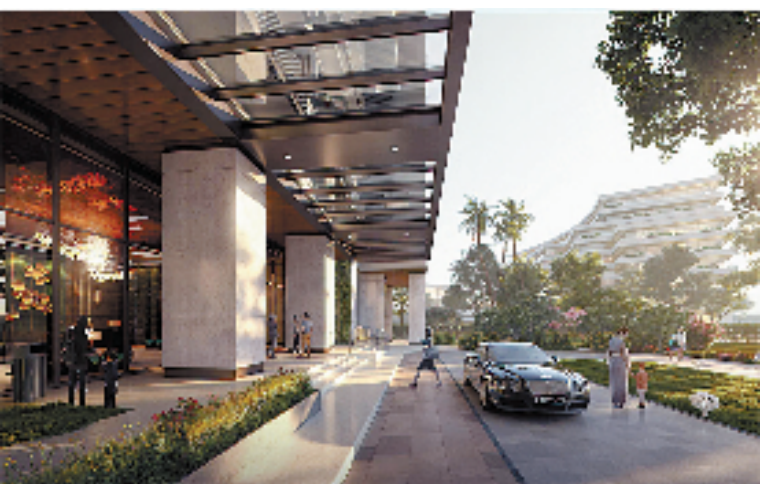
新世界·江明月朗园效果图

杭州望江新城,一个总建筑面积约74万平方米、总投资高达230亿元的“巨无霸”城市综合体已雄姿初现。这里,就是“新世界·城市艺术中心”。