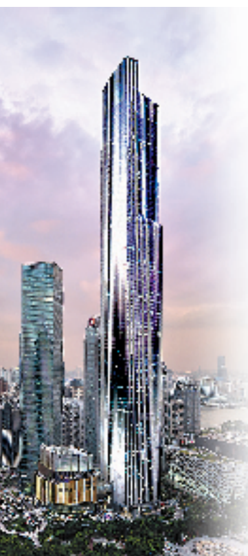
广州周大福金融中心实景图

正如新世界中国地产有限公司的品牌承诺——“予城新蕴”所指的那样,一幅“产城融合、独特韵味、绿色共享”的美丽新世界画卷,徐徐展开。