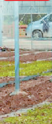
在湖山村中草药示范田,村民种植中草药。