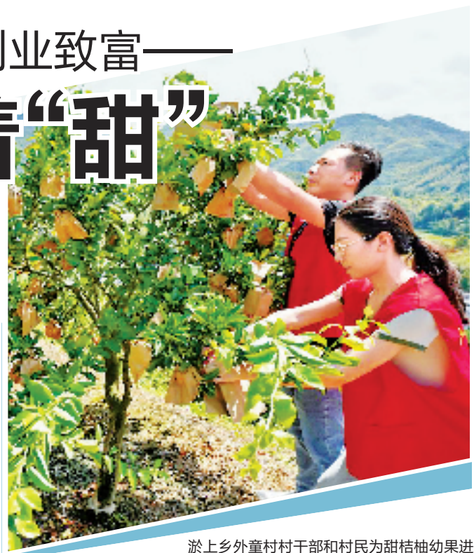
淤上乡外童村村干部和村民为甜桔柚幼果进行套袋防虫。

“书记示范田”里,一批以羊肚菌、高山果蔬为主的乡村特色产业日渐成熟,有效带动当地农户增收,扩大村集体经济增收渠道,激发了山区发展新动能。