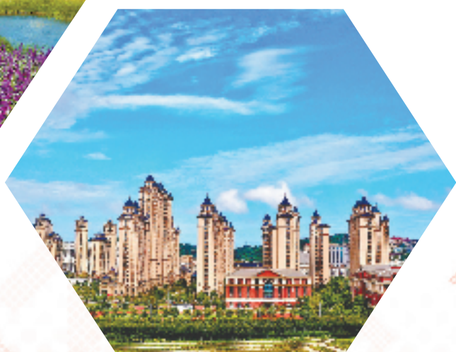
“海上花园”独特气质扑面而来