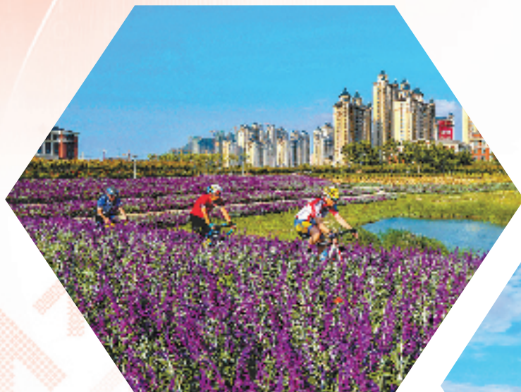
姹紫嫣红、山花烂漫的海岛,吸引了市民骑行出游。