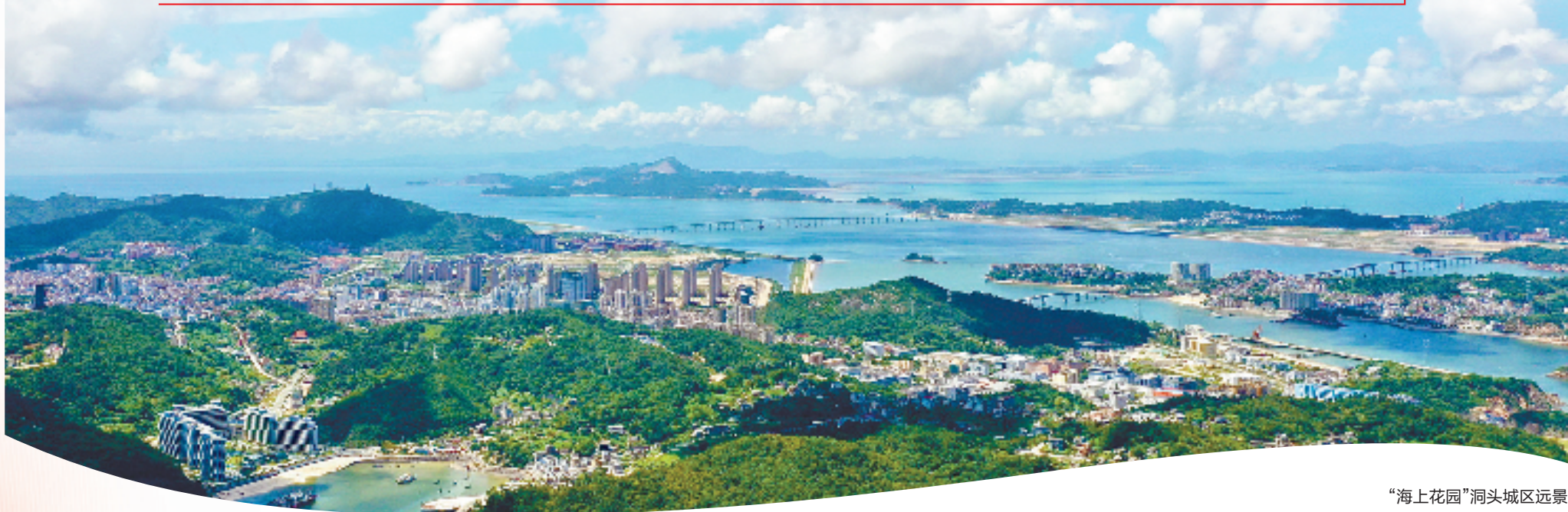
“海上花园”洞头城区远景

如今,万顷碧波之中的东海明珠,不仅闪耀着山海之美,也讲述着海岛人奔向共同富裕的“蓝色故事”。