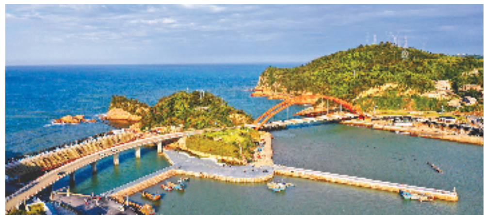
丰富的海洋资源是洞头发展的最大底气

戏。为放大“渔”的优势,洞头持续建立“三位一体”现代渔农业服务体系,以环渔港带和海洋食品产业园建设为核心,强化平台助力、科技赋能,推进一二三产融合发展,争创国家级渔港经济区。