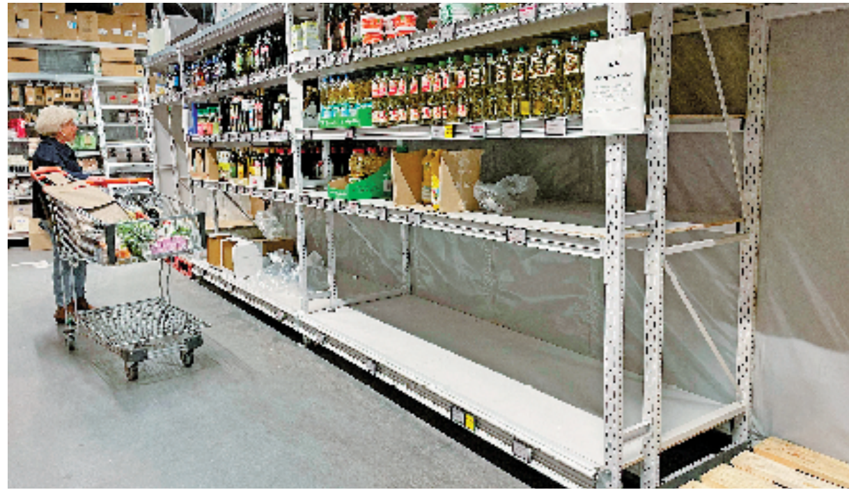
3月29日，顾客在比利时布鲁塞尔的一家超市选购食用油。该超市食用油供货紧张，每位顾客限购两件。