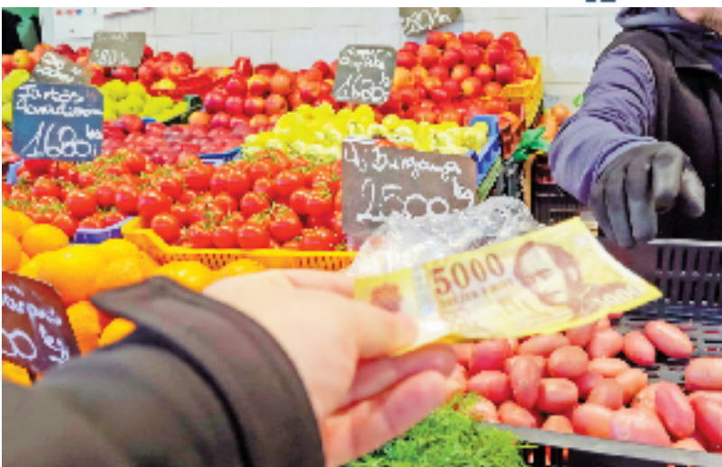
2022年4月8日，顾客在匈牙利布达佩斯一家市场购物。