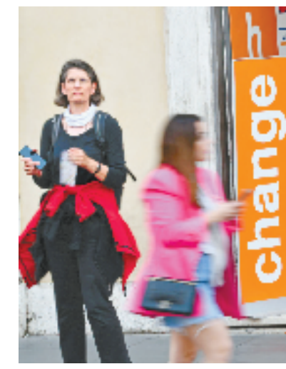
5月1日，人们走过意大利罗马的一处货币兑换点。欧盟统计局近日公布的初步统计数据显示，意大利4月通胀率为6.6%，处于高位。