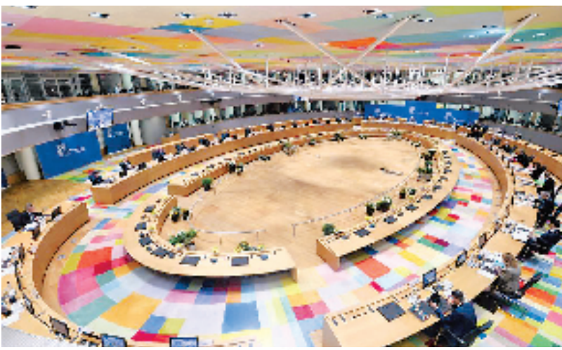
3月24日在比利时布鲁塞尔欧盟总部拍摄的欧盟峰会现场。