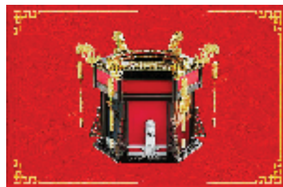
天安门六景灯数字藏品

浙江首个数字藏品规范化交易平台。该公司由地方国企杭州市金融投资集团有限公司控股。这也是当下为数不多国资入局的案例。刘天骄评价它在引导数字藏品业规范发展上具有全国示范意义。