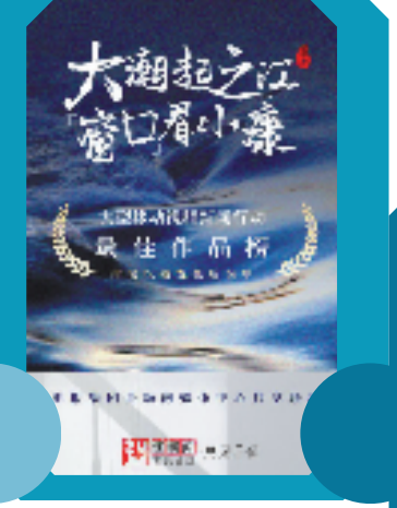
↑“大潮起之江‘窗口’看小康”大型移动视频新闻行动。 →“新春走基层·26县山货闹新春”活动。 →“好日子 新故事”共同富裕示范先行大型融媒体新闻行动。 →“文化微地标”带你走进身边的风景。