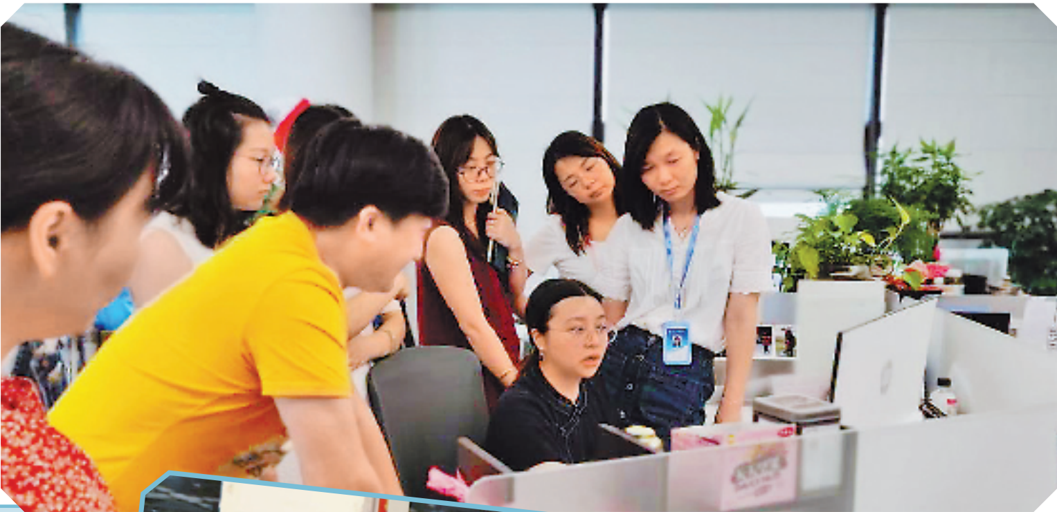
浙报集团嘉兴分社记者与共享联盟嘉善站成员进行业务交流分享。

今年以来,我省多地疫情散发多发,联盟成员积极参与抗疫报道,在《浙江日报》刊发抗疫报道170余篇,在浙江新闻客户端刊发4300多篇,对鼓舞全社会战胜疫情发挥了重要作用。两年来,联盟成员单位在《浙江日报》刊发稿件3500多篇,浙报集团新媒体端稿件6.1万多篇、阅读量超31亿,以接地气的故事、精彩纷呈的图文视频,奏响了浙江迈向共同富裕的交响乐。