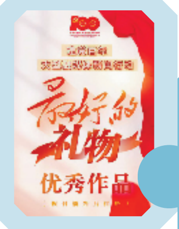
↑“最好的礼物”建党百年大型融媒体新闻行动。 →抗疫报道截图

这些精彩的视频,由当地县融与浙报集团驻地分社联手制作推出,不仅在浙报集团所属媒体平台分发,还在联盟成员当地的掌上客户端呈现;不仅在省内传播,还通过人民号、头条号等头部平台进行立体化传播,进一步提升了传播效应。这样的大型联动策划,还有“飞越山河,俯瞰浙江”“留浙迎春、福至万家”等10多场,充分呈现“重要窗口”的动人场景。