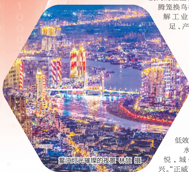
鳌江灯光璀璨的夜景

此外,平阳在乡村治理中积极融入道德“因子”,让精神“富”起来。通过实施乡村道德提升行动,树婚丧新风、传优良家风、扬最美民风,不断提升乡村社会文明程度。去年以来,平阳以全国文明城市创建为目标,大力深化文明单位、文明社区、文明村“三大创建”工作,已创成县级以上文明单位124个、文明社区60个、文明村344个,让文明之花香飘城乡。同时,以建设“初心起航之地·红色志愿之城”为主题,构建“全域化”志愿服务队伍,已成立志愿服务队伍1027支,志愿者人员达到25.05万人。