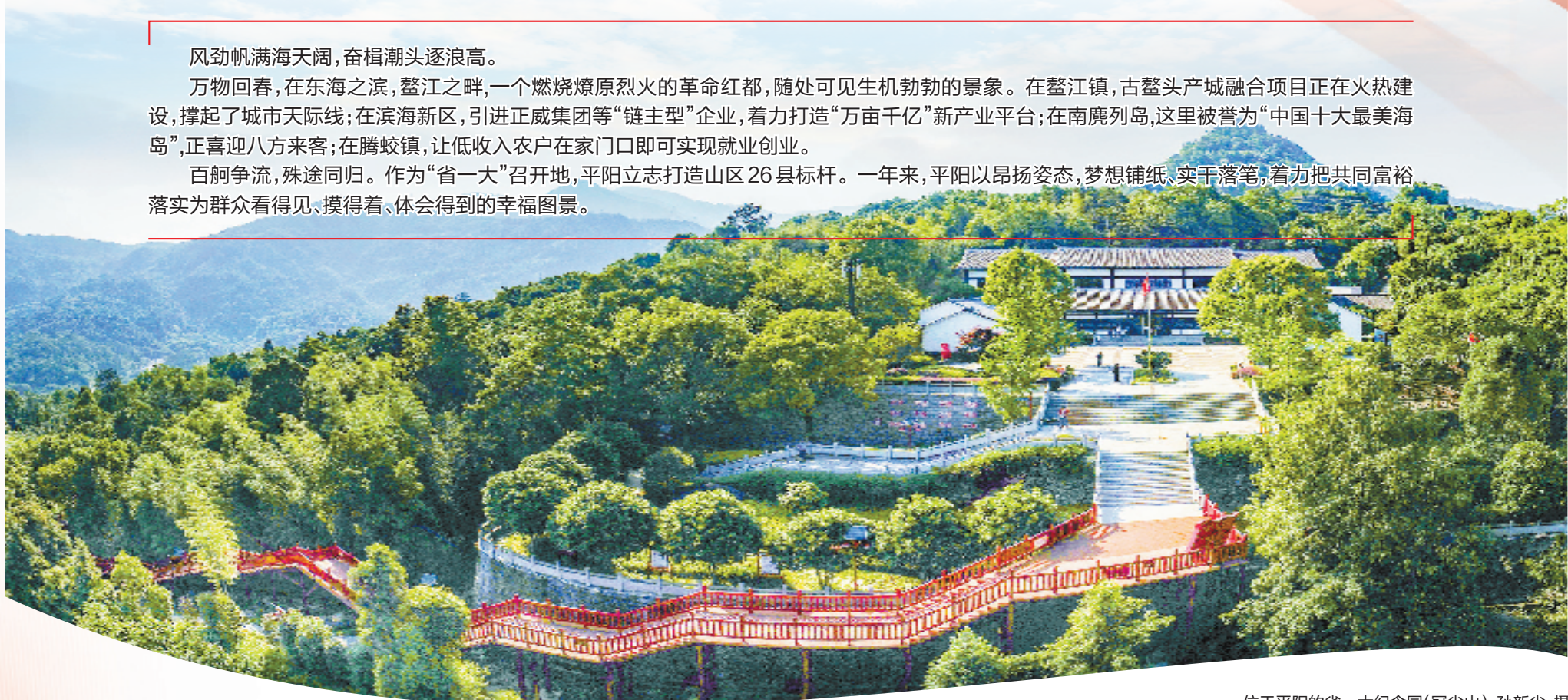
位于平阳的省一大纪念馆(冠尖山)

百舸争流,殊途同归。作为“省一大”召开地,平阳立志打造山区26县标杆。一年来,平阳以昂扬姿态,梦想铺纸、实干落笔,着力把共同富裕,落实为群众看得见、摸得着、体会得到的幸福图景。