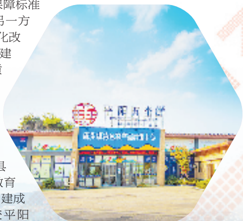
平阳五个鲜展销中心