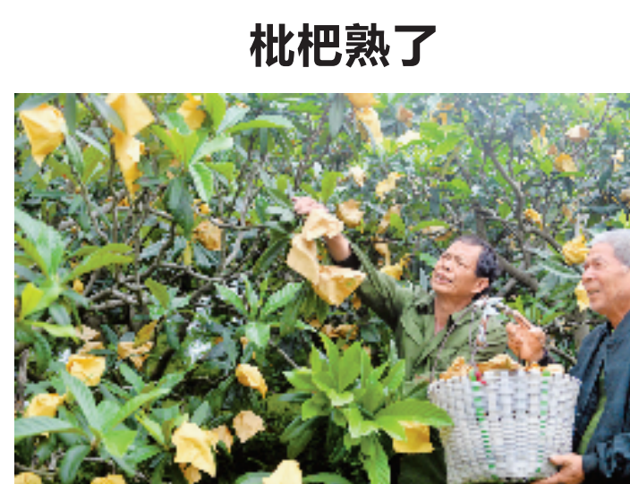
在台州市路桥区桐屿街道小桐村,果农们连日来忙着采摘枇杷。今年当地的枇杷产量高、成熟早,果农的收入将好于往年。

事实上,义乌不动产治理一直走在全国前列。记者从省自然资源厅自然资源确权登记局了解到,早在2019年义乌市不动产登记业务就被纳入国家综合创新试点,2021年10月上线浙江省“不动产智治”试点应用,采用“链式管理”思路,以不动产单元代码和单元表作为载体,进行多跨协同和业务贯通,为打造不动产智治浙江模式探路。“目前,该试点应用已通过验收,计划于2022年5月底前实现全省推广。”省自然资源厅自然资源确权登记局局长方剑强表示。