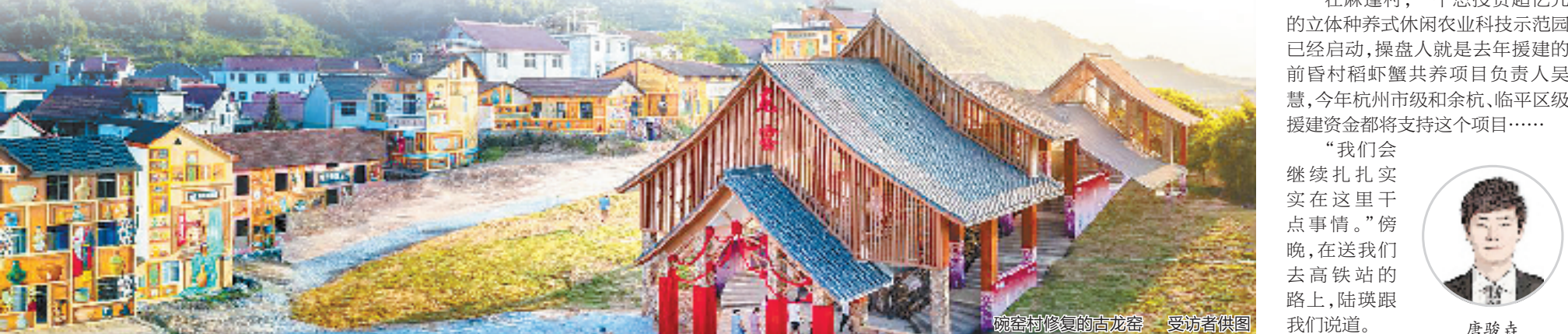
碗窑村修复的古龙窑