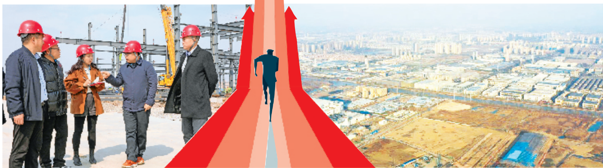
陈发兵(右二)带着记者(右三)到正威华东总部制造基地项目现场了解项目进度。