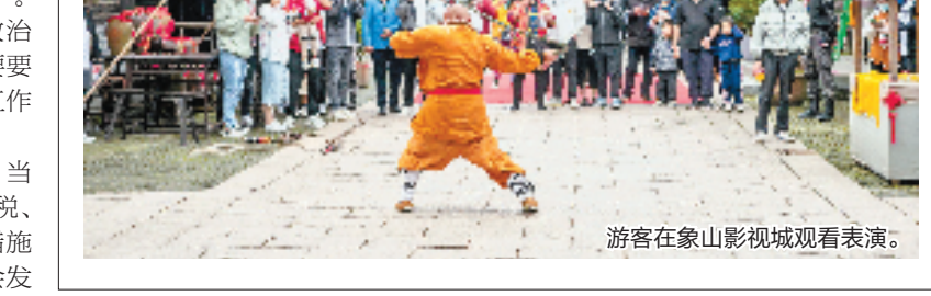
游客在象山影视城观看表演。

象山影视城也带动了当地农村“共富”。象山星光影视小镇周边,灯光器材、餐饮民宿、群众演员等影视拍摄及旅游配套产业闭环基本形成,周边村镇还有340多家民宿,带动上万人