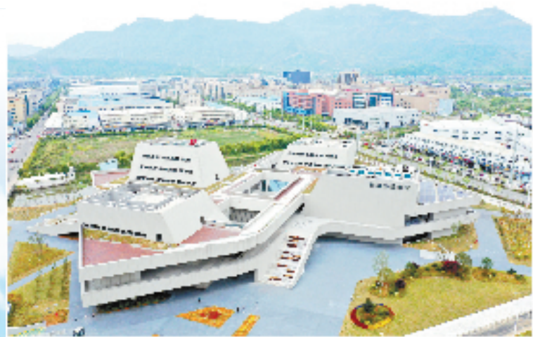
黄岩智能模具小镇客厅

“两水一加”完成工业化原始资本积累，开启商品化和市场化进程。1986年，在全国率先出台保护和规范股份合作制企业的文件，成为中国股份合作制企业发祥地和民营经济首发区之一。“台州老工业基地”“中国模具之乡”“中国日用塑料制品之都”等一系列称号，镌刻了黄岩的发展印记。