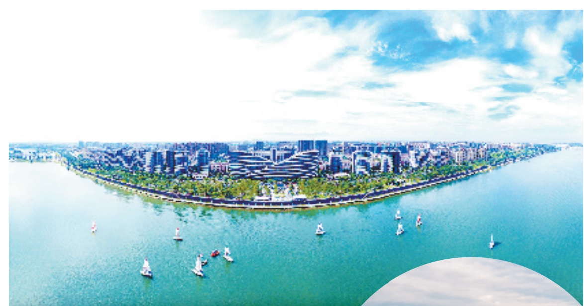
2021中国帆船城市超级联赛(衢江站)

不久前,省文旅厅发布浙江省旅游业“微改造、精提升”2021年季度累计评价指数,衢江区荣获全省第5名。衢江区文广旅体局围绕“微改造、精提升”,大力推动旅游业高质量发展,助力四省边际共同富裕示范区建设。截至2021年底,衢江区纳入省微改造全生命周期系统项目共295个,完成投资4.94亿元,投资完成率达106.24%。