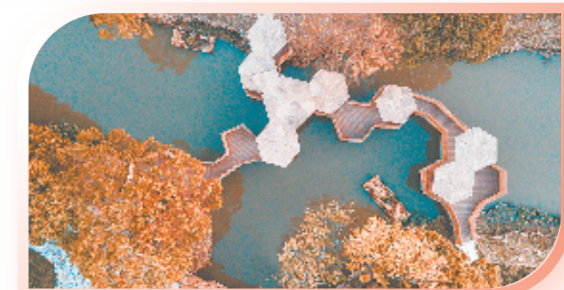
海宁长安一周王庙“共同富裕”县城乡风貌区五金港景区

作为中组部城市基层党建联系示范点,海宁创新打造“潮城·红色(e)家”品牌(“红色”即坚持党建引领,“一”即体现系统集成,“e”即