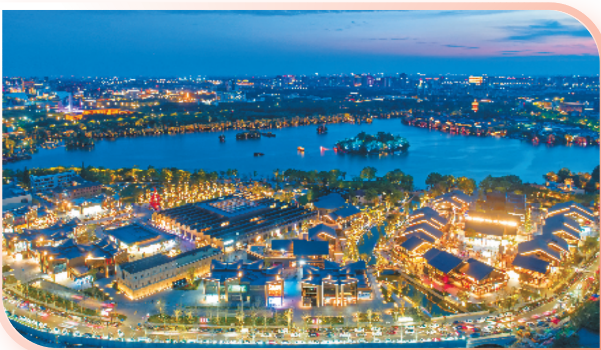
烟雨江南·红船圣地城市新区风貌区实景鸟瞰

笔者在嘉兴市城乡风貌办看到,一张综合性、一站式的可视化大屏,实现了全域城乡风貌整治项目“一张图”管理。“用虚拟的三维场景化手段导入样板区创建案例,为各县(市、区)提供技术和政策指引;同时,管理