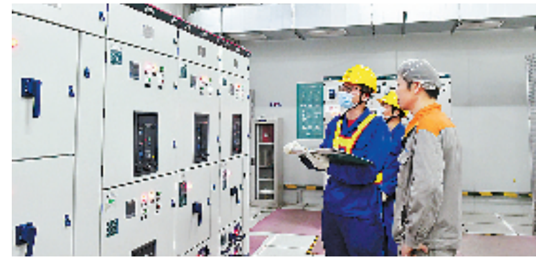
4月18日,国网杭州市临平区供电公司需求侧管理中心工作人员在临平银泰城配电房检查供电装置。

为打造互联网形态下的多元融合需求侧管理体系,保障电网安全稳定运行,推动区域绿色低碳转型,