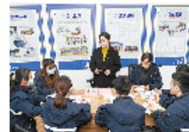
“清风入企”宣讲活动

接下来,按照“试点先行、稳步推开、以点带面”的工作方针,南浔经济开发区力争先行打造清廉企业示范点,着力发挥典型引领作用。