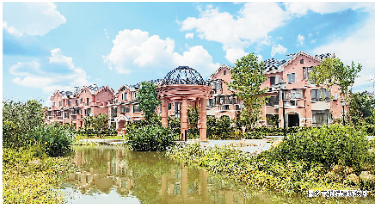
桐乡市濮院镇新联村

此外,为加快农村发展,突破农村发展土地制约要素,桐乡还在深化宅基地改革方面持续推出了新农村集聚、宅基地有偿退出、宅基地有偿选位、闲置农房盘活等多项改革举措,老百姓的房子越住越好,腰包越来越鼓。2021年,桐乡村级集体经济总收入达14亿元,农村居民人均可支配收入43709元,同比增长8.3%,城乡居民收入比值1.56,继续保持嘉兴五县(市)最小值。