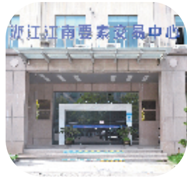
浙江江南要素交易中心

随着村集体经济不断发展壮大,农民口袋也跟着鼓起来了。海宁还积极引导有条件的村股份合作社按规范开展股份分红,目前全市累计分红金额达2.34亿元。