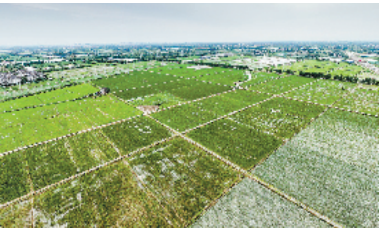
秀洲区新塍镇火炬村全域土地整治

接下去,秀洲区将重点实施1+4全域土地综合整治与生态修复工程,即新塍镇国家级示范点+油车港镇、王江泾镇南部、洪合镇中部、王店镇东部4个地区,共涉及34个行政村,总计土地25.69万亩,新建高标准农田4.1万亩。