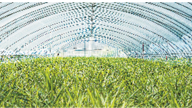
南湖区新丰生姜—晚稻大棚

据悉,“万元千斤”模式依靠科技和模式创新,持续挖掘粮食综合增产潜力,提高科技兴粮水平。比如“大棚西(甜)瓜—晚稻”复种模式,西瓜亩产2500公斤左右,甜瓜可达2750公斤左右,晚稻亩产510公斤。截至目前,全区共计推广“万元千斤”栽培模式3.5万亩,在实现亩产千斤粮的同时,亩产值平均达到1.6万元,农业生产效益得到显著提高。