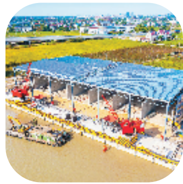
平湖市新埭镇大齐塘村“众筹码头”

数据显示,2021年,平湖全市行政村集体经常性收入均全部达到180万元以上,农村居民人均可支配收入43914元,同比增长10.1%,城乡居民人均可支配收入比值缩小至1.64,低收入农户人均可支配收入21657元,同比增长13.5%。