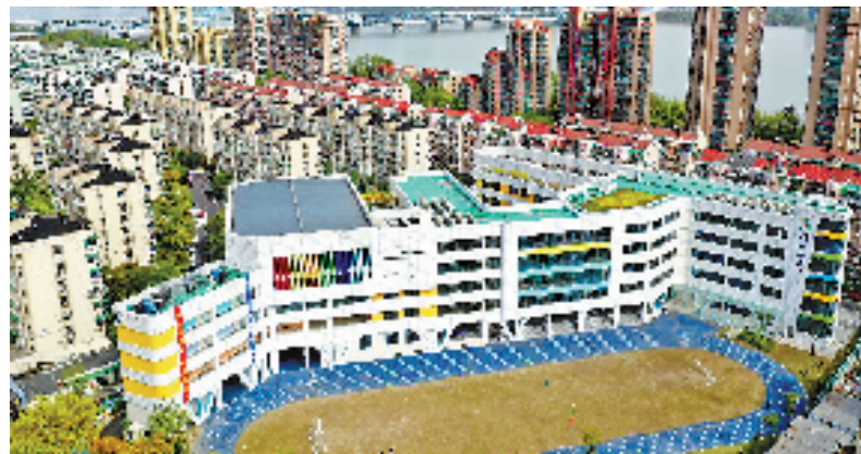
胜利山南小学入驻,孩子们在家门口就可以享受优质教育资源。