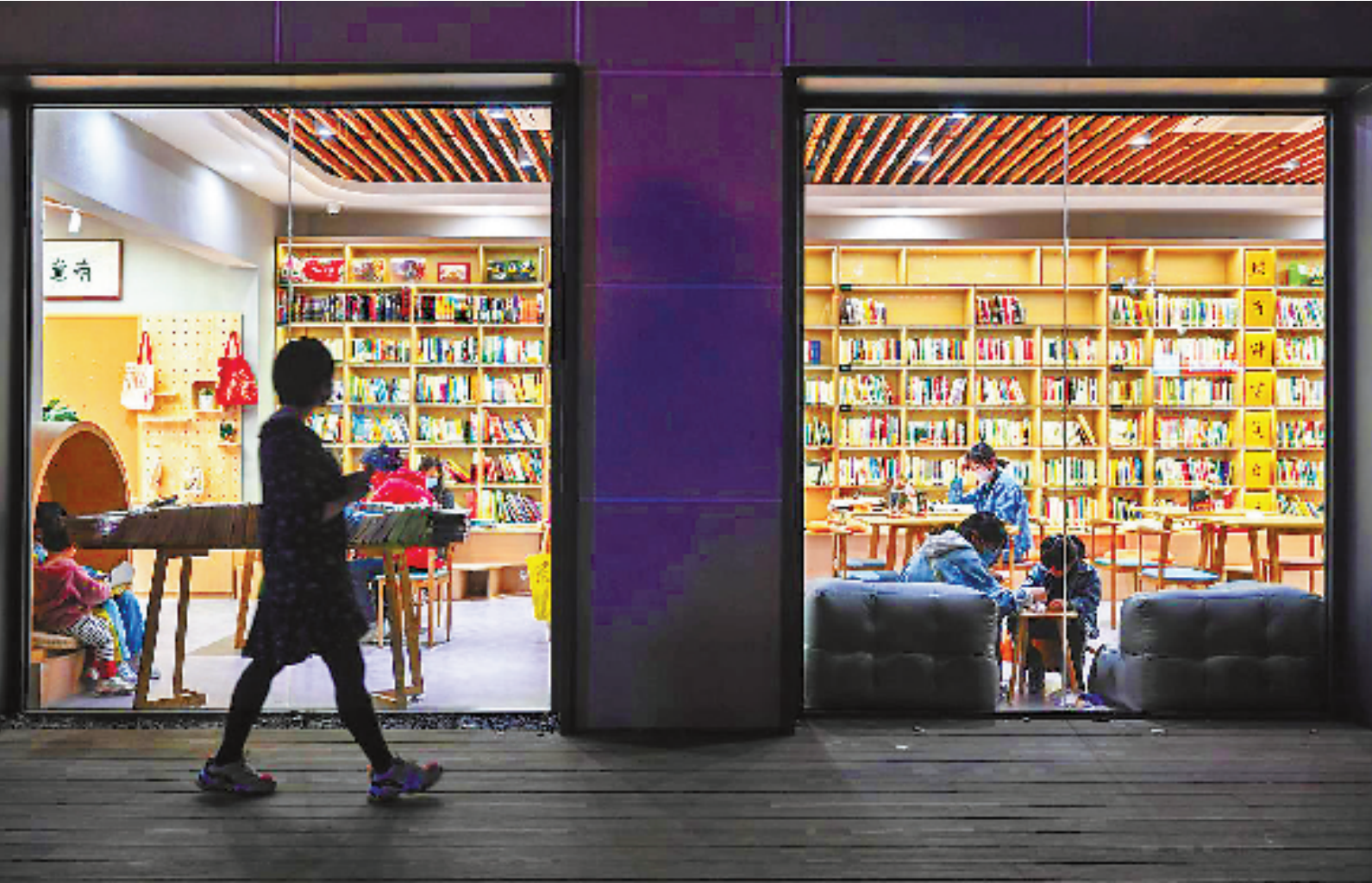
晚饭后,城市书房成了周边居民休闲阅读的好去处。