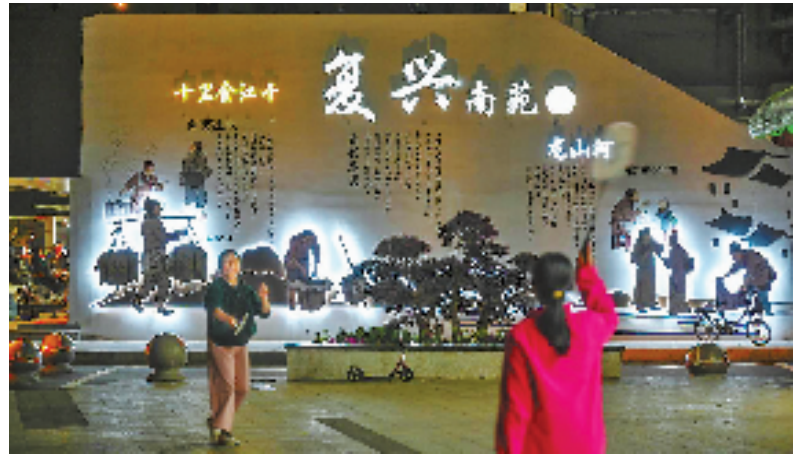
复兴南苑入口,立体墙画融入了南星地区的人文历史,满满的市井烟火味。