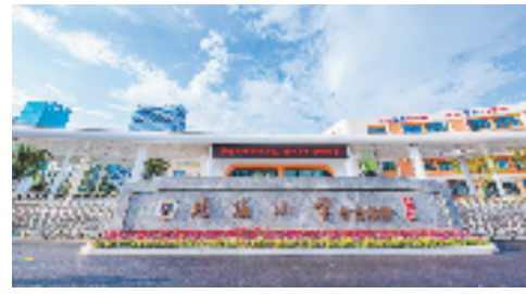
北海小学梅山校区