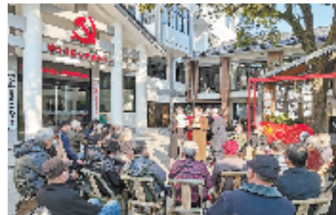
越城区开展共建活动