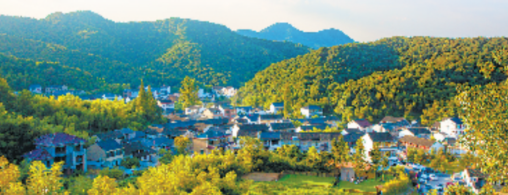
越城区鉴湖街道坡塘村