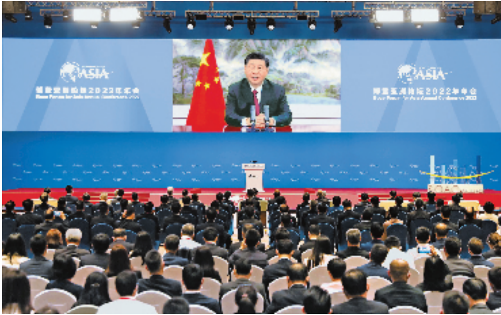
4月21日上午,博鳌亚洲论坛2022年年会开幕式在海南博鳌举行,国家主席习近平以视频方式发表题为《携手迎接挑战,合作开创未来》的主旨演讲。

难曲折都不能阻挡历史前进的车轮。面对重重挑战,我们决不能丧失信心、犹疑退缩,而是要坚定信心、激流勇进。习近平强调,冲出迷雾走向光明,最强大的力量是同心合力,最有效的方法是和衷共济。过去两年多来,国际社会为应对新冠肺炎疫情挑战、推动世界经济复苏发展作出了艰苦努力。困难和挑战进一步告诉我们,人类是休戚与共的命运共同体,各国要顺应和