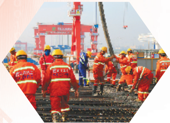
杭甬复线宁波一期项目施工人员进行混凝土浇筑作业