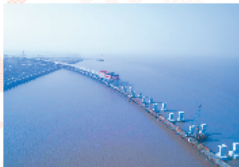
杭甬复线宁波一期项目滨海高架桥施工现场

作为省交通集团旗下专业化的高速公路建设管理公司和杭甬复线宁波一期项目建设管理单位,浙交建设公司围绕省交通集团“争做世界一流企业”的总目标,秉持“认真、顶真、较真”的精神,奋力打造国内交通建设管理头部企业。今年,浙交建设公司将紧紧围绕扩大有效投资的要求,高效推进杭甬复线杭绍段、杭甬复线宁波一期等项目建设。同时,强化担当、主动作为,加快推进一批前期项目落地,确保甬台温高速拓宽台州北段、杭甬复线宁波三期等项目年内开工,努力争做全省落实重大战略的标杆,为交通强省和共同富裕示范区建设作出更大的贡献。