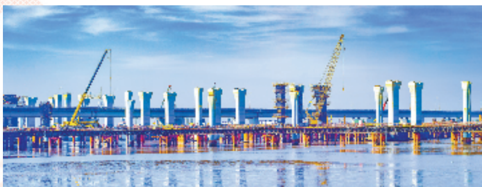
正在建设中的杭甬复线宁波一期项目滨海互通栈桥