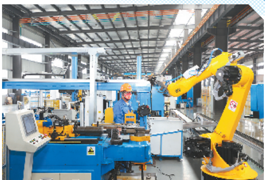
位于吴兴区八里店镇的金洲管道科技股份有限公司,工人在不锈钢车间作业。