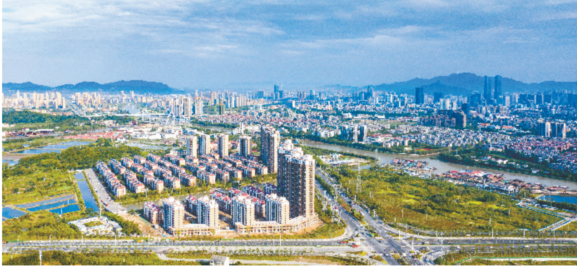
奋进中的吴兴