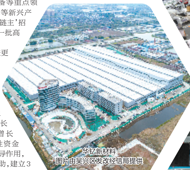
华钺新材料