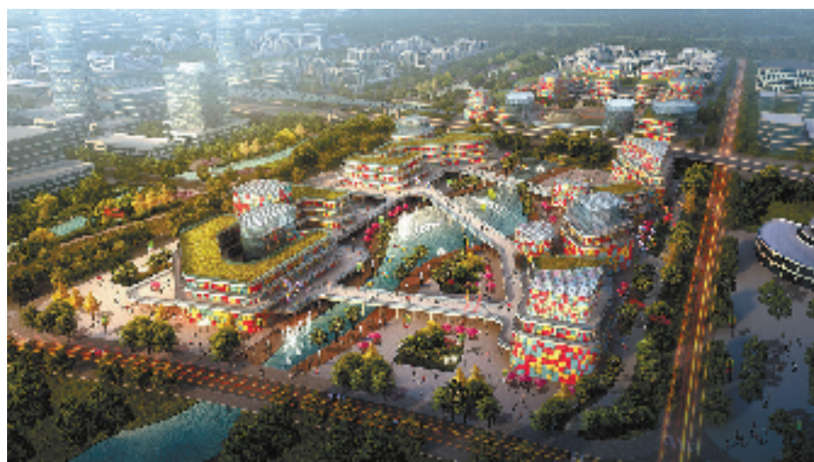
瑞安智能汽车关键零部件产业平台效果图

2021年,松田年产500万套智能控制无刷电机生产线项目等多个省重大产业项目落地。松田项目总用地面积约223亩,总投资10亿元,引进高精度冲床、机械手、注塑机、生产流水线、平衡机、中央集中供料系统、加工中心等国内领先设备,建立无刷电机研发生产基地。项目建成后,可实现年产值13.6亿元。截至目前,项目一期已