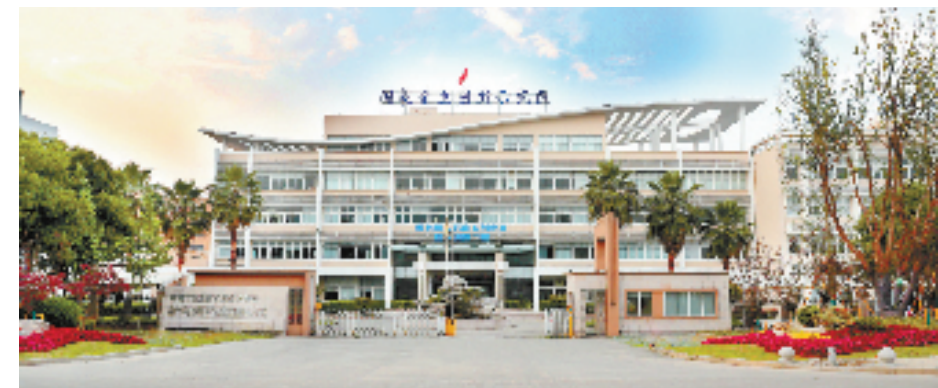
温州环大罗山科创走廊塘下创新中心

汽车进入智能化时代,一些本土传统汽车零部件龙头企业正面临关键技术难题。智能传感器研究院相关负责人说,目前我国