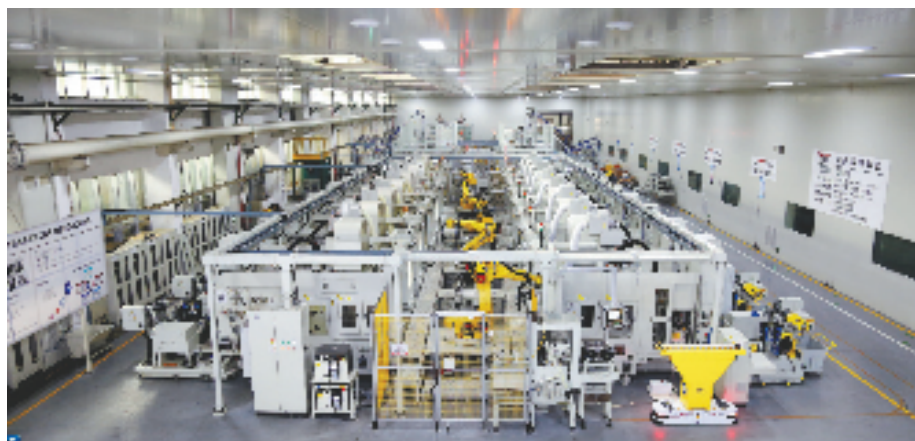
温州瑞明工业股份有限公司智能车间

据塘下镇相关负责人介绍,2021年,“万亩千亿”新产业平台完成产业项目投资累计总额超100亿元,全年实现工业产值170亿元。平台内新开工产业项目11个,锦佳、龙纪等项目已完工投产。总投资20亿元的恩驰年产20万台高端汽车智能光电系统总成以及30万台逆变器建设项目,总投资6亿元的宝尔特年产30万套交/直流充电桩总成项目,成功获批第一批省重大产业项目,获得262亩用地奖补指标。截至目前,平台内共有总投资约300亿元的产业项目50个。