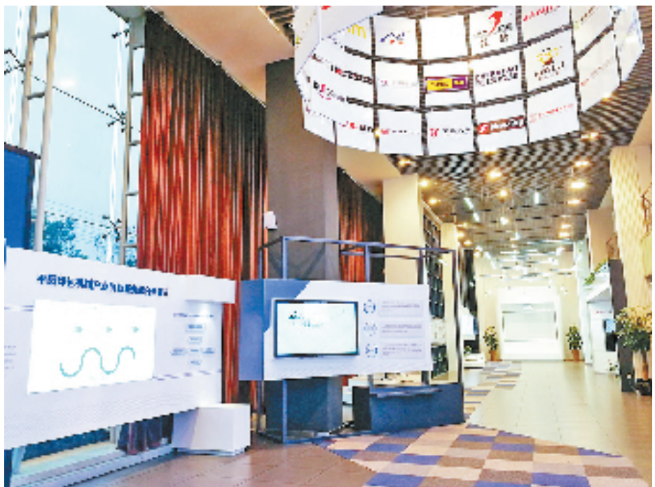
平阳高端印包机械服务综合体展示厅