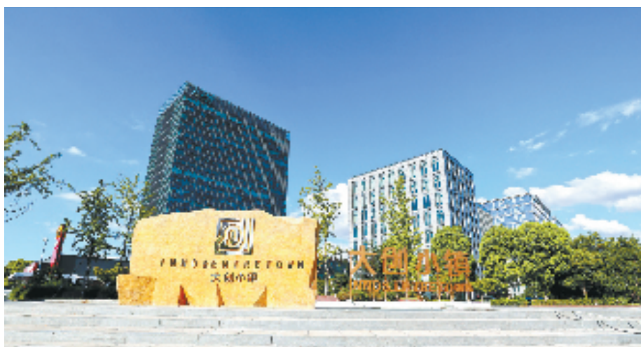
钱塘设有9大产业平台，图为大创小镇。

同时，钱塘还积极探索打造产业大脑建设，推进产业能级提升。比如，推出生物医药产业大脑，已完成产业地图、研发物料