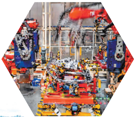
钱塘正在打造全球先进制造业基地

培育适宜制造业高质量发展的肥沃土壤，下一步，钱塘将继续做优做强特色产业，加快形成新材料、智能制造、生命健康、集成电路等4个千亿级产业集群，推动产业发展能级进入国家级新区第一序列，让“钱塘智造”的金名片更加亮丽。