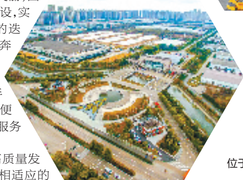
杭州唯一的综合保税区位于钱塘