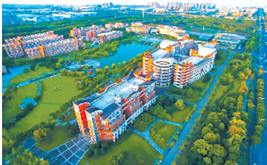
钱塘拥有全省规模最大的高教园区