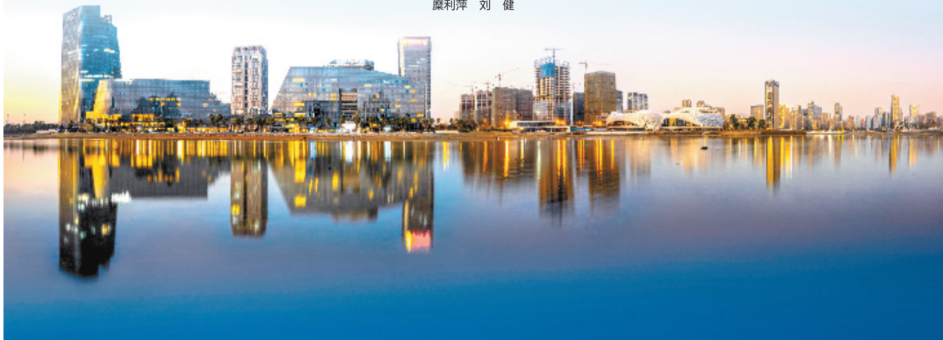
钱塘是浙江的制造业大区