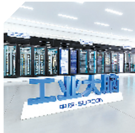
中控技术工业大脑

聚合新动能、放大新优势,制造强区迈新步。接下来,该区将锚定建设“创新驱动示范区、高质量发展先行区”的新使命、新定位,不断做强产业核心竞争力,努力为全省制造业高质量发展大局作出新的更大贡献。