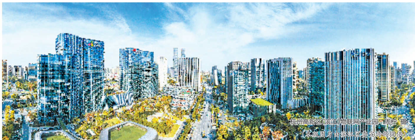
杭州高新区(滨江)物联网产业园