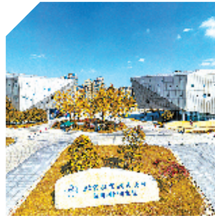
北航杭州研究院省级重点实验室