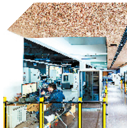
力太工业互联网平台助力轴承、汽配等行业数字化转型