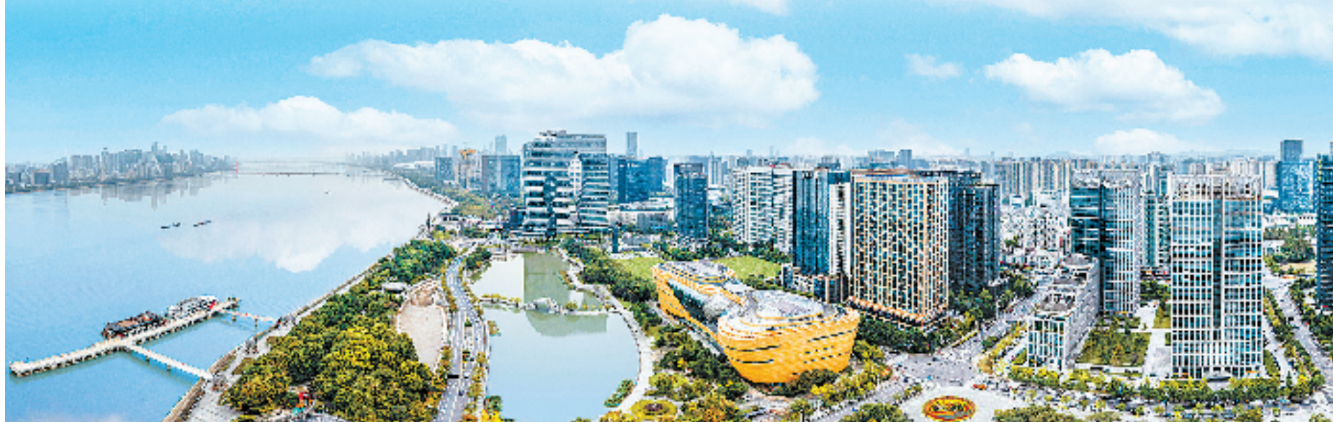
杭州高新区(滨江)航拍图