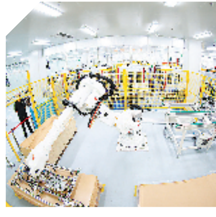
正泰全国产光伏组件智能工厂