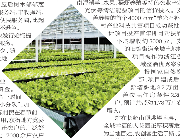
南浔农高区果蔬孵化园项目