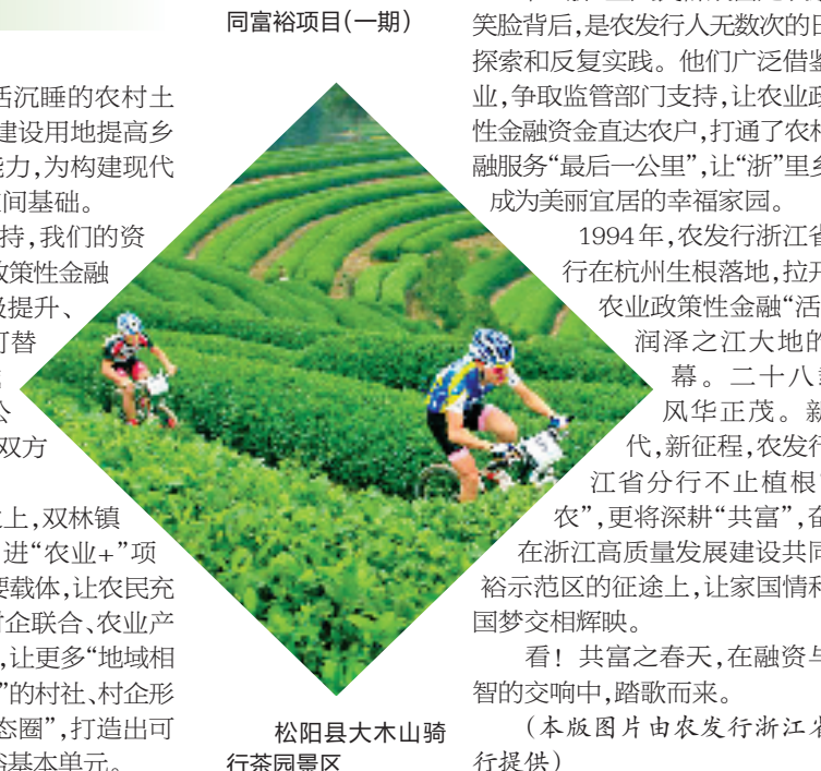
松阳县大木山骑行茶园景区