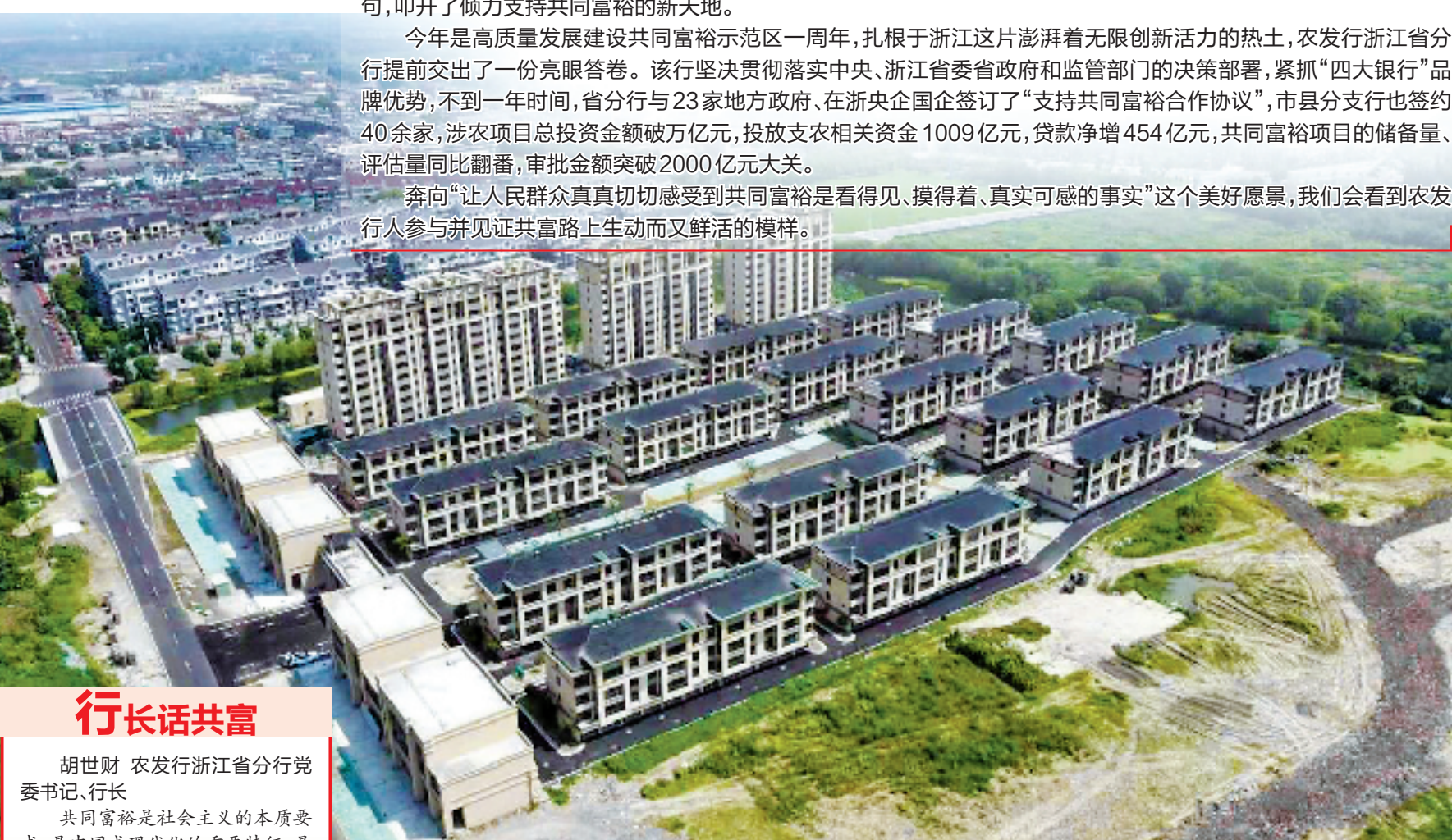
南浔区善�塘镇全域土地综合整治与生态修复工程

奔向“让人民群众真真切切感受到共同富裕是看得见、摸得着、真实可感的事实”这个美好愿景,我们会看到农发行人参与并见证共富路上生动而又鲜活的样子。