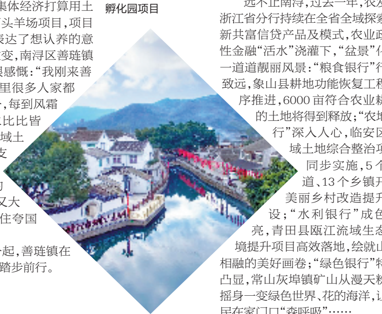
平阳县昆阳镇共同富裕项目(一期)