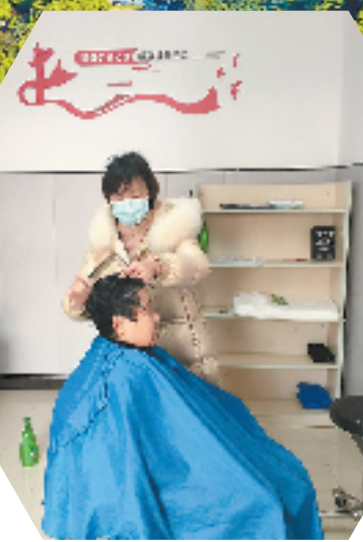
皋城村“青春小屋”为村里老人提供免费理发服务

美丽乡村背后，社会基层治理久久为功。为了巩固景中村整治提升成果，皋城村将垃圾分类和美丽庭院写入了《村规民约》，第一年实行时还从党员和村民代表中聘