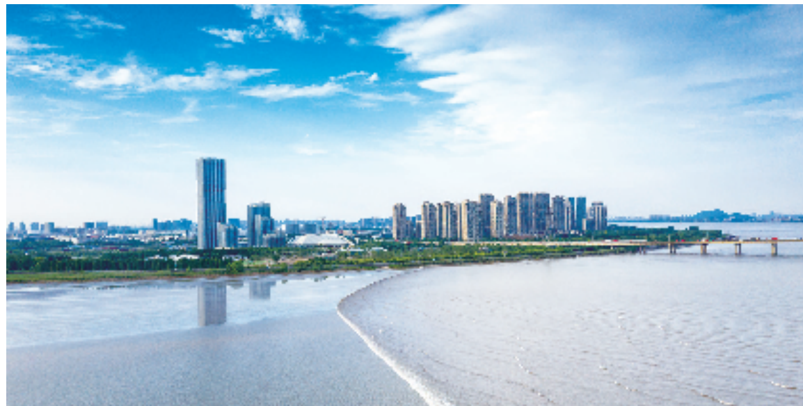
钱塘区借助打造高能级战略平台，加快建设世界级智能制造产业集群。

坚持科技和制度创新双轮驱动，钱塘促进全球要素资源整配置，赋能全区产业发展。制度创新