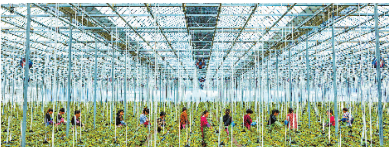
绿沃川农场