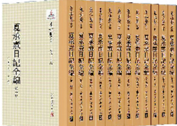
《夏承焘日记全编》,浙江古籍出版社出版。