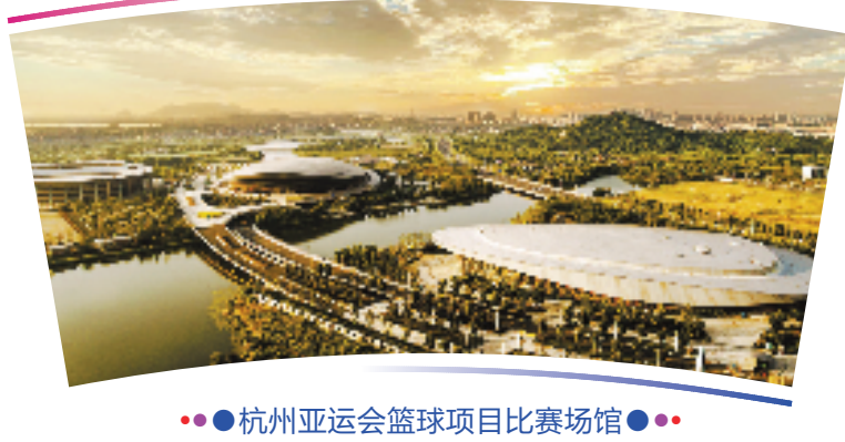
●●杭州亚运会篮球项目比赛场馆●●

位于绍兴市越城区,总建筑面积72010平方米,观众席位数9552个。场馆采取“老馆新用”的方式,悬挂在场馆上空的环形屏幕将呈现比赛的实时画面、比分和资讯。