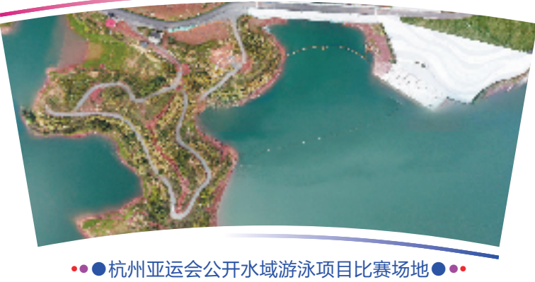
●●杭州亚运会公开水域游泳项目比赛场地●●

位于淳安县界首乡淳安亚运分村南侧,包含公开水域游泳比赛及热身场地。公开水域游泳也称马拉松游泳。公开水域游泳比赛赛道单圈全长1.666公里,赛程为6圈,总长10公里。