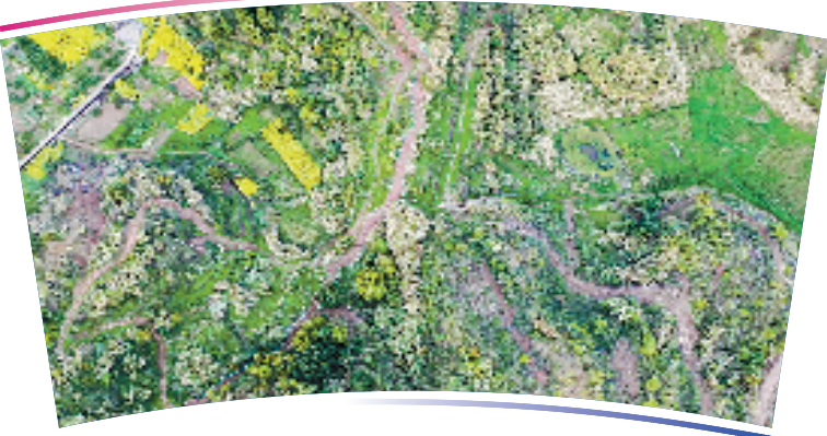
●●杭州亚运会山地自行车项目比赛场地●●

位于淳安县界首乡淳安亚运分村中心周围,赛道依地形修建,赛道总长约4.6公里,赛程1圈,分为普通路段、圆木障碍路段、石块障碍路段、混合障碍路段、飞包路段及外墙路段,共设21处技术难点。