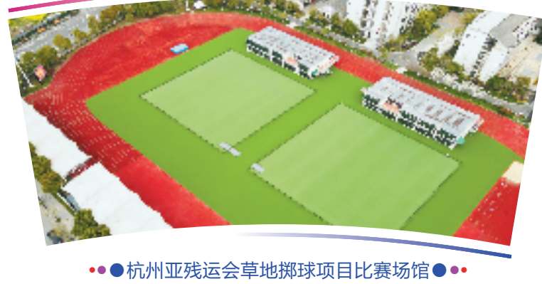
●●杭州亚残运会草地掷球项目比赛场馆●●

位于杭州市钱塘区,是杭州亚残运会独立竞赛场馆之一,也是亚残运会历史上第一个由中学操场改建而成的竞赛场馆,总建筑面积3.5万平方米,总席位数1000个。