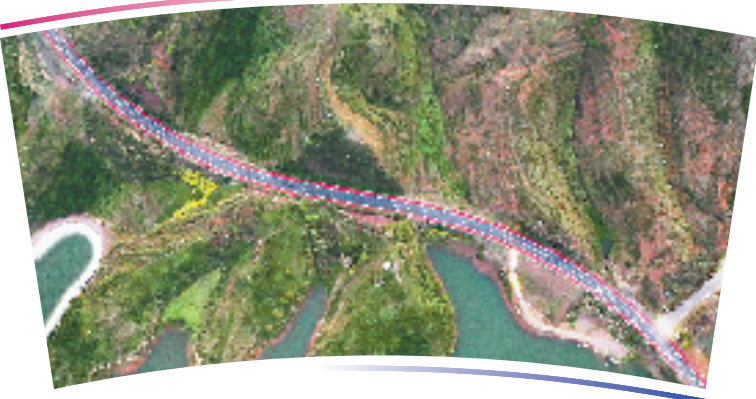
●●杭州亚运会公路自行车项目比赛场地●●

位于淳安县界首乡淳安亚运分村中心周围,比赛赛道借用县内环湖公路,男子赛道208公里,女子赛道142公里,沿线涉及14个乡镇,且具有沿湖、沿村、沿山等特点。