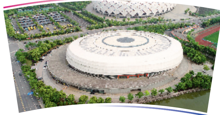
●●杭州亚运会排球项目比赛场馆●●

位于绍兴市柯桥区,含主比赛馆及热身馆。该场馆总建筑面积18513平方米,观众席位数3666个,以“珠莲(联)璧盒(合)”为设计理念。