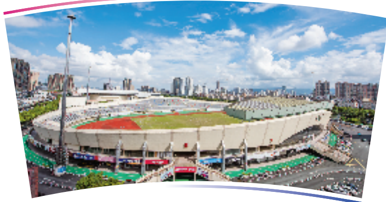
●●杭州亚运会足球项目比赛场馆●●

位于温州市鹿城区温州体育中心,总建筑面积14843平方米,观众席位数15192个。体育场建于1995年,曾举办过浙江省第12届运动会田径比赛、全国乙级足球联赛等赛事。