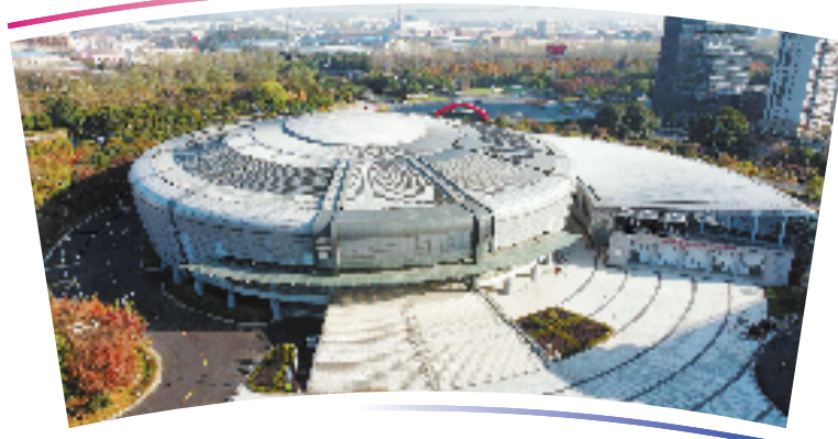
●●杭州亚运会排球项目比赛场馆●●

位于德清县体育中心,总建筑面积18296平方米,观众席位数3000个,含比赛场及热身馆。体育中心2014年建成启用,呈正圆形。该场馆曾举办中国职业排球联赛、2017年全运会男子排球预赛等赛事。