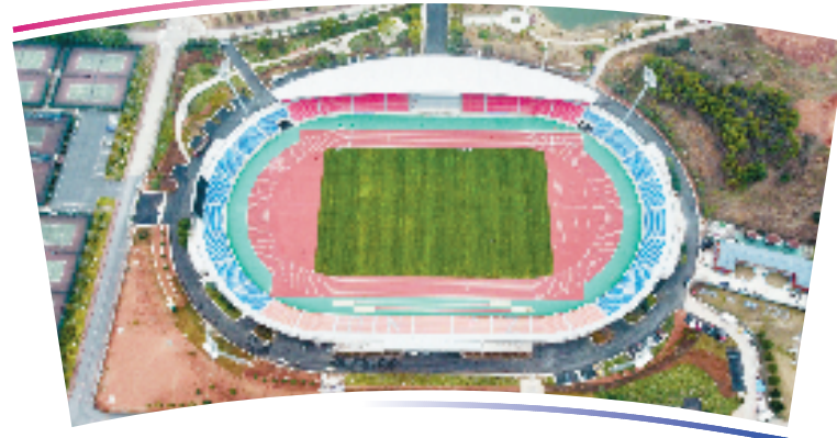
●●杭州亚运会足球项目比赛场馆●●

位于金华市婺城区,总建筑面积8391平方米,观众席位数11349个。东体育场为比赛场地,北体育场则为热身场地。该场馆曾举办过浙江省第12届大学生运动会、浙江省大学生田径精英赛等赛事。