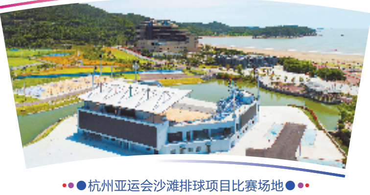
●●杭州亚运会沙滩排球项目比赛场地●●

位于象山县半边山景区内,占地面积约6.4万平方米,含比赛场地2片、热身场地2片、训练场地3片,大约可容纳3000名观众观赛。