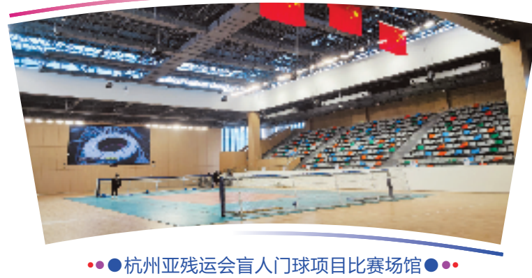
●●杭州亚残运会盲人门球项目比赛场馆●●

位于杭州市临平区,是杭州亚残运会的独立竞赛场馆之一,含主副比赛场馆及热身馆,总建筑面积56854平方米。场馆充分考虑了视障运动员的需求,如从场馆门厅开始,通往每一个功能用房及比赛场地的路面上都设置了盲道等。