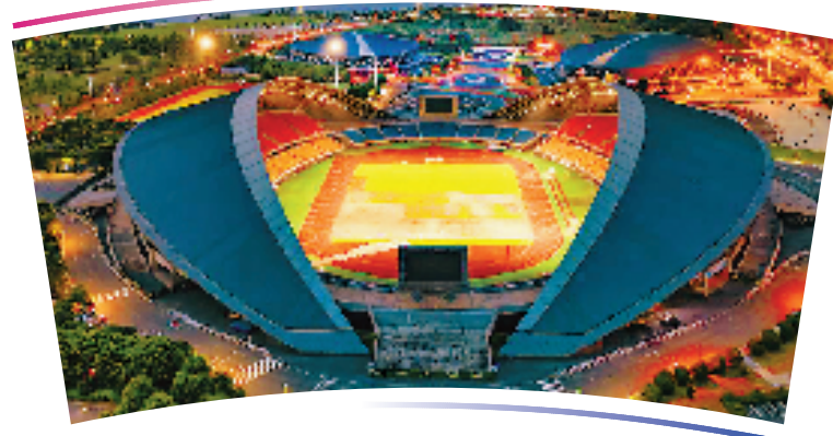
●●杭州亚运会足球项目比赛场馆●●

位于金华市婺城区,含比赛场及热身场地,总建筑面积44064平方米,观众席位数2.98万个。该场馆曾举办过2017年亚洲田径大奖赛、2017年中甲联赛绿城主场比赛等赛事。