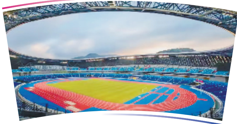
●●杭州亚运会足球项目比赛场馆●●

位于温州市龙湾区,总建筑面积70500平方米,观众席位数50000个,含主比赛场及热身场。整体设计采用仿生造型,以“瓯帆云影”为立意,既像海鸥,又像飘逸的丝绸。