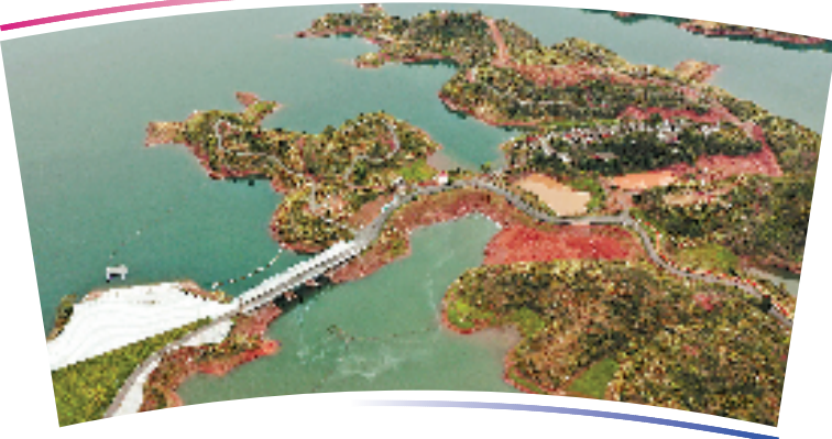
●●杭州亚运会铁人三项项目比赛场地●●

位于淳安县界首乡淳安亚运分村南侧,场地包含游泳赛道、自行车赛道、跑步赛道及热身场地。铁人三项比赛场地依据当地地形而建,以赛区转换区为中心形成三叶草布局。自行车赛道全长6.6公里,游泳赛道长0.75公里;跑步赛道每圈长2.5公里。