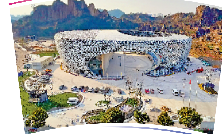
●●杭州亚运会攀岩项目比赛场馆●●

位于绍兴市柯桥区齐贤街道羊山石佛山景区内,总建筑面积8950平方米,主体建筑高度小于24米,设计座位2100个。 场馆设计提炼自江南水乡丝绸产业文化符号——“蚕茧”,并融合纺织物特有的飘逸质感,提取攀岩等极限运动中力量与动感的美学线条,形成了建筑形象与运动主题相契合的设计概念。半开放的设计与羊山的自然景观相融,通过借景的手法引入羊山石城原始风景。 场馆在设计时使用了高强度混凝土材料,并用这种材料定制了近2000个长方形或三角形的块面,像积木一样完成了整个造型。整个场馆镂空部分占55%,在达到视觉近刚感的同时,也有遮阳、节能的效果。