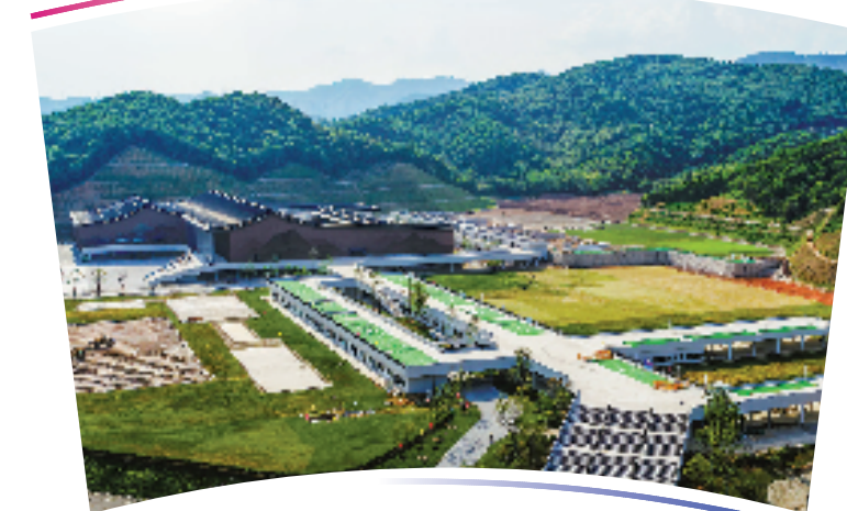
●●杭州亚运会射击、射箭和现代五项项目比赛场馆及训练场馆●●

位于杭州市富阳区银湖街道,含射击综合馆(包括射击比赛、现代五项的游泳和击剑比赛)、新闻媒体与安保中心、4片室外飞碟靶场、射箭场、现代五项激光跑场地和击剑场地等,总建筑面积82360平方米,观众席位数约1.3万个。 在综合馆东侧及南侧看台上,设置了3.4万余片旋转百叶,在阳光照射下,呈现出一幅光影效果(富春山居图),随着阳光角度的变换,画作也会有所不同。 同时,每一片不同角度的百叶后还隐藏着一条自主研发角度可调的截光槽,每一条灯槽内都装着一盏智能光学发光体,当夜幕降临时,就可以由多媒体程序控制形成《富春山居图》。