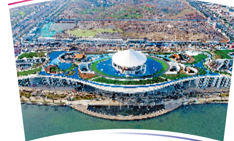
●●杭州亚运会三人制篮球项目比赛场馆●●

位于湖州德清地理信息小镇运动中心,是全国第一个固定的三人制篮球比赛场馆。整个中心总建筑面积约5万平方米,为两层钢结构地景建筑。 中心选址依山傍水,三人制篮球场作为最核心的比赛场地被设置在城市轴线上,位于整个运动中心的最高处,在这里,周边景色尽收眼底,比赛时,运动员、观众等也会有特别的体验。 整个场馆的主色系采用了杭州亚运会色彩系统中的水光蓝,馆内观众席数约1500个。场馆中央顶部安装了一块360度的高清大屏,在赛时将坐在场馆各处的观众提供更直观、清晰的观赛感受。