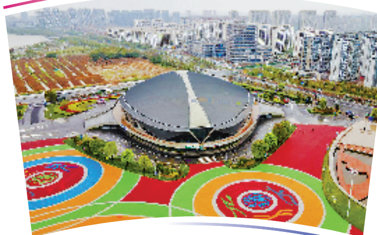
●●杭州亚运会藤球项目比赛场馆●●

位于金华市婺城区,含比赛场地及热身场地。总建筑面积26981平方米,观众席位数4570个。整体造型由椭圆形平面组成,简洁的墙面配以三角形的金属构件,建筑造型规则而不失灵性。体育馆曾举办乒超联赛等赛事。 该场馆为改建的亚运场馆,其原有的规模已经符合藤球比赛要求,改造力度相对较小,除了部分功能用房搭建外,最大的变化在于灯光、音响等设施的升级。改造后,场馆达到厅堂、体育场馆扩声系统设计规范中体育场一级指标。同时,改造后的灯光也能满足藤球比赛场地高清转播对主摄像机、副摄像机垂直照度、照度均匀度、显色性及色温等方面的要求。赛后,场地照明灯具还可以重新安装,以调整成符合篮球、排球等场地灯光的要求。