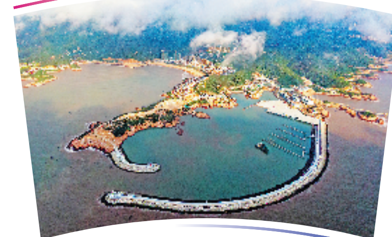
●●杭州亚运会帆船项目比赛场地及训练场馆●●

位于宁波市象山县松兰山景区内,该中心含帆船比赛及热身场地和相关竞赛、配套服务用房,总建筑面积16403平方米。 地块自然条件非常优越,海域面积、风向风力、洋流浪向、气候水温均非常适合举办大型海洋运动比赛。场馆一半在陆地,一半在海中,是杭州亚运会唯一涉及海域建设的比赛场馆。2021年9月,第十四届全国运动会帆船比赛在该场馆成功举办。 建设时,场馆创新绿色施工,将陆地爆破工程产生的石料用于海域防波堤建设,有效利用废弃原料,减少了运输过程对环境造成的破坏。