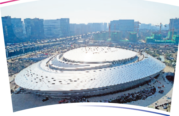
●●杭州亚运会电子竞技项目比赛场馆●●

位于杭州市拱墅区北景园生态公园内,是国内第一座亚运会赛事标准的专业电子竞技场馆。场馆占地12838平方米,建筑面积79790平方米,座席4087个,以“星际漩涡”为设计理念,外形酷似“星际战舰”。 从外观设计到硬件基础设施配置等,相比传统体育场馆,电竞比赛的专业场馆有着很大区别。 为了让观众在观赛时有身临其境的感觉,馆内顶部安装了氛围射灯,达到演唱会级别震撼舞台的灯光效果。在每个观众席下,设置了吸声系统。当比赛进入白热化阶段时,观众发出的喝彩声随时可以切入转播画面,把现场氛围传递给在场外其他端口观看比赛的观众。