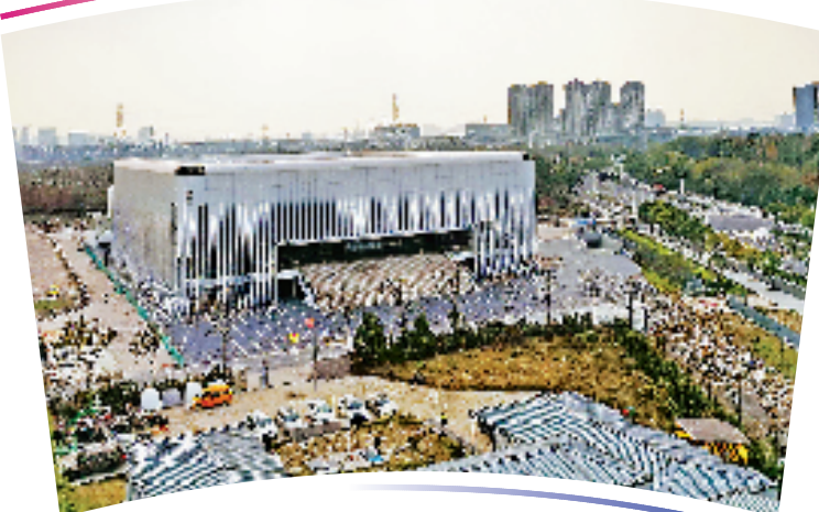
●●杭州亚运会手球项目比赛场馆●●

位于浙江师范大学萧山校区,是杭州亚运会全部12个新建场馆中唯一一个位于高校内的竞赛场馆。场馆总建筑面积约1.639万平方米,观众席位数2302个。 设计时,抽象出了钱塘江水和江南丝绸的感觉,提出“水幔”意象,契合江南的烟雨蒙蒙,象征着杭州在互联网时代互联互通快速发展的形象。场馆的主馆和副馆外共设计了308缕“水幔”,就像条条丝绸飘带一般,从场馆顶部缓缓垂落并延伸至地面。每一缕“水幔”在靠近地面处都配有灯光,一到夜晚,场馆就能投屏呈现出特定图案,美轮美奂。同时,这些“水幔”还是一个天然遮阳帘,让场馆内更凉爽,并减少室内眩光,提高室内视觉舒适度。该场馆赛后将转换为综合性体育馆,用于学校教学。