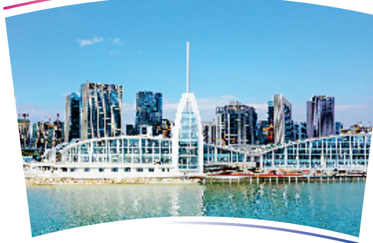
●●杭州亚运会龙舟项目比赛场地及训练场馆●●

位于温州市瓯海区,观众席位数344个,沿河两岸约有2万个站席。整体建筑以“龙跃东瓯境·桨舞丝路情”为设计理念,造型整体以龙形为基础,由瓯江的波澜、温州的奇山演绎而来。主楼依河而建,似蛟龙跃入水中,紧挨主楼的塔楼,造型似直立的划浆龙舟。 龙舟赛道长1200米,宽130米,共6条赛道。上下游设5座节制闸,赛时水深3.5米,平时可自由调节水位,起到防洪、排涝的作用。 中心场馆从龙头到龙尾,依次为观龙台、运动员综合楼、终点塔和潜龙阁。观龙台圆弧外侧共铺设了286块玻璃。正式比赛时,赛事实况等都能显示在幕墙上。该基地赛后将永久性保留,作为全国最专业的龙舟竞赛基地。