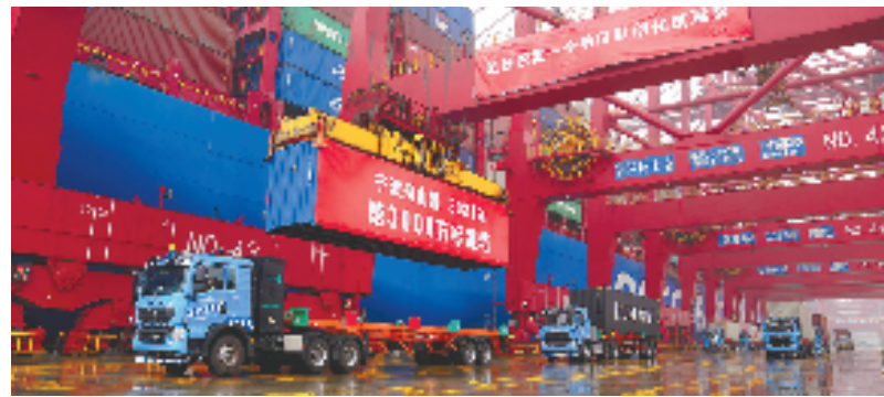
2021年12月16日,宁波舟山港年集装箱吞吐量首破3000万标准箱起吊仪式在集团智慧港口先行地、宁波舟山港梅山港区集装箱码头举行。

宁波舟山港三大港区直通铁路的优势得到充分发挥,宁波舟山港南方海铁联运第一大港地位日益凸显。到去年底,全港的海铁班列已增至21条,业务辐射16个省市(自治区)、61个地级市,覆盖了全国近一半的海铁网络,为加快构建以国内大循环为主体、国内国际双循环相互促进的新发展格局提供了强大的物流保障。