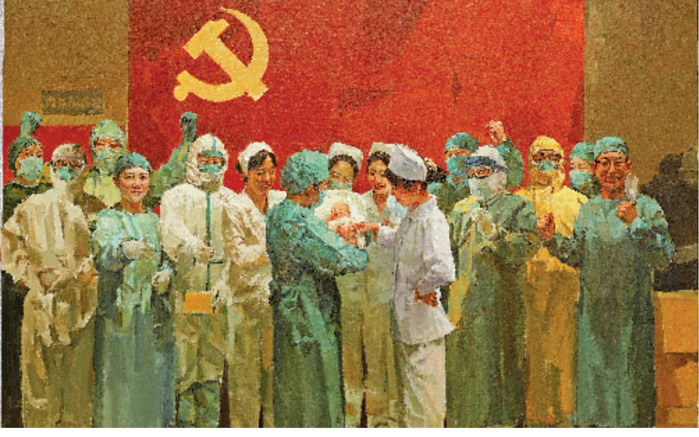
《新生——浙里抗疫》油画(局部) 郭大勇 绘