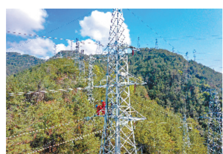
实践落地 扣紧闭环整改的责任链条

据了解，电网企业政治生态监督评价体系涵盖政治统领、选人用人育人、反腐倡廉、治理保障、思想引领、创新创效、绩效激励、权益保障、关心关爱、外部协作等“十大运行机制”，分为“过程”和“结果”两个评价维度。前者主要聚焦电网企业经营关键领域和重点环节，设置政治生态动态过程评价指标26项、评价要点89条、指标因子91个，全面覆盖企业政治生态建设各个方面要求，全面检验“十大运行机制”实际落地情况。后者紧密联系企业日常业务和政治生态建设要求，设置“风清气正”“人和业兴”两方面的结果导向评价指标，通过政治建设引领企业生产经营，将企业改革发展成果用于检验政治生态建设成效。