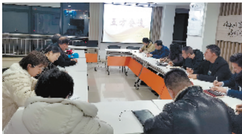
吴兴区湖东街道东柿社区开展“五方会谈”，就垃圾驿站改造、地库垃圾堆放、坡道改造、停车难等问题进行讨论。

“现在小区的经营性收支情况及物业专项维修资金使用情况每月都会在‘三务e公开’平台、公示栏、楼