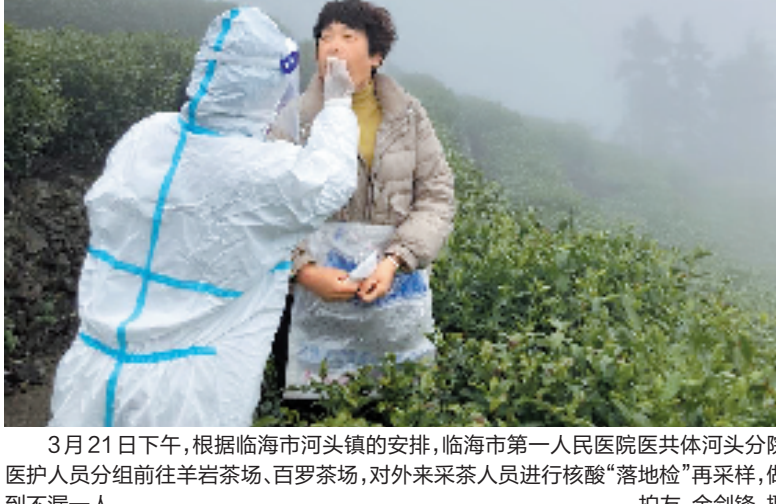
3月21日下午,根据临海市河头镇的安排,临海市第一人民医院医共体河头分院医护人员分组前往羊岩茶场、百罗茶场,对外来采茶人员进行核酸“落地检”再采样,做到不漏一人。

政管理局负责人段瑞说,自平湖市启动I级响应以来,快递全面停运,韵达快递嘉兴分拨中心共有近10万件快递滞留在场地内。于是,他马上请求分拨中心安排人手。 20日上午9时20分,在嘉兴南湖物流园堆积如山的包裹堆里,10多名快递员飞快地细致地翻找起来。经过近1小时的翻找,他们终于在“山”里找出了吴女士的“救命包裹”。“找到了!”快递小哥们欢呼起来,此时的他们一个个都累出了一身汗。 包裹找到了,怎样快速进平湖再派送?平湖邮政管理局和邮政公司立即安排邮车,派出工作人员,在平湖与南湖的交界处接棒,再驱车十几公里,于20日中午将包裹送到吴女士家中。至此,这场经由多方联动的爱心接力终于画上了圆满的句号。