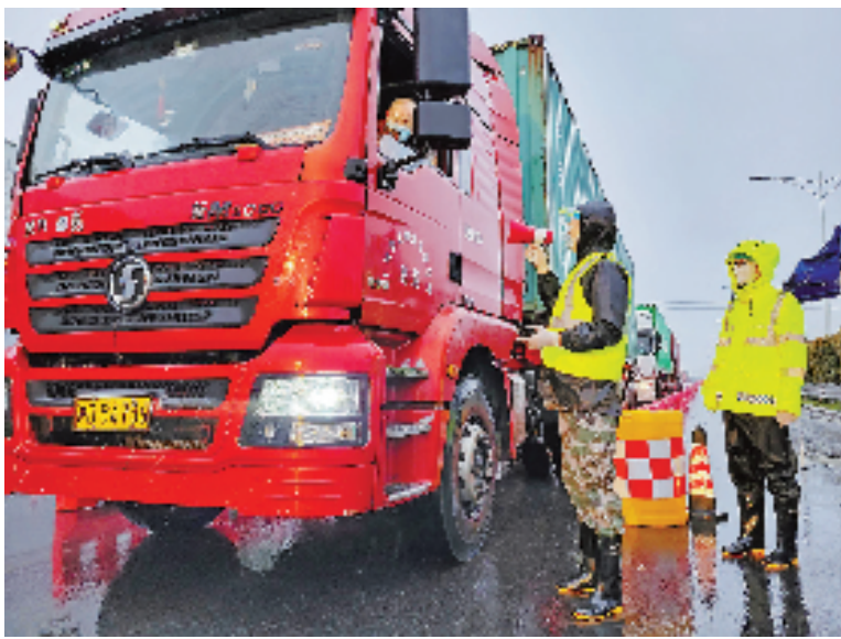
在姚杨公路省际疫情防控卡点,蔡叶新和队员正在查验司机的核酸检测阴性证明。

看似简单的工作,其实最考验队员的原则性和应对策略。“我们面临最多的有两种情况,要么是核