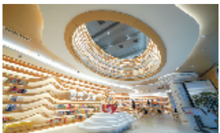
实践案例:缙云县阳冰书房

按照“修旧如旧、建新如旧”的原则,景宁先后完成了溪口—毛垟、溪口—东坑—大漈沿线的A级旅游景区、景区镇、3A级景区村庄等全域旅游环境整治,并以畚乡文化为主线,解码优秀文化基因,深化“一乡一品”品牌建设,推出一系列文化基因项目、融合产品、节庆演艺活动,使当地“摇身一变”成为一座集休闲、观光、娱乐、体验为一体的美丽花园,描绘出一幅“城在景中,景在城中”的美丽画卷。