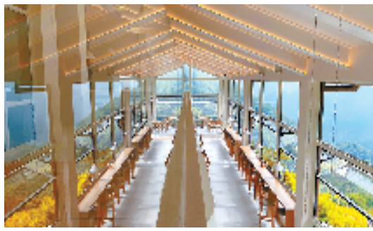
云和梯田景区云端咖啡