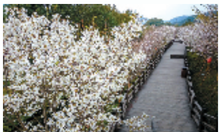
实践案例:莲都区古堰画乡樱花绿道