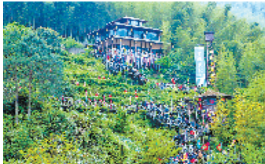
景宁县东弄畲族民歌展演