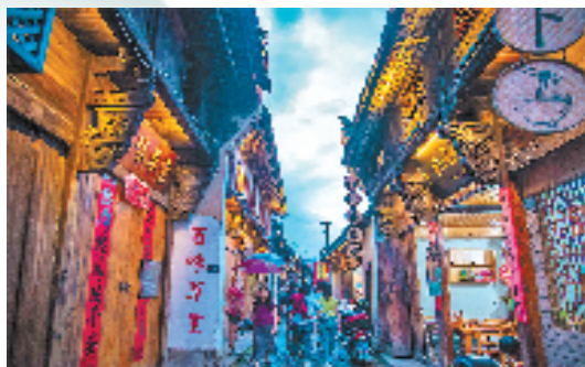
松阳县城明清老街