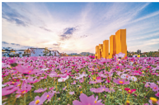
安吉古城国家考古遗址公园