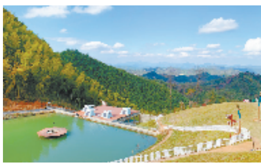
报福镇半岛露营基地