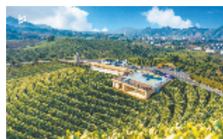
实践案例:溪龙乡万亩茶园观光平台

鄞吴镇归仁里老街,融入文化因子,打捞乡愁记忆,营造主客共享空间。将原有建筑改造成印章馆、手工制扇馆、里仁书屋、幸福邻里中心、乡贤馆等,人们可以在这里观摩制扇工艺、读书写字,感受“昌硕故里、人文鄞吴”的清雅风韵。