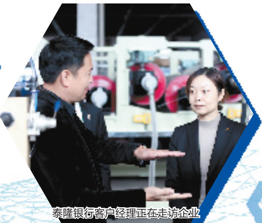
泰隆银行客户经理正在走访企业