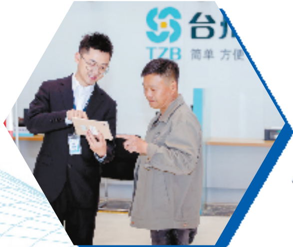
台州银行客户经理 指导市民掌上办贷