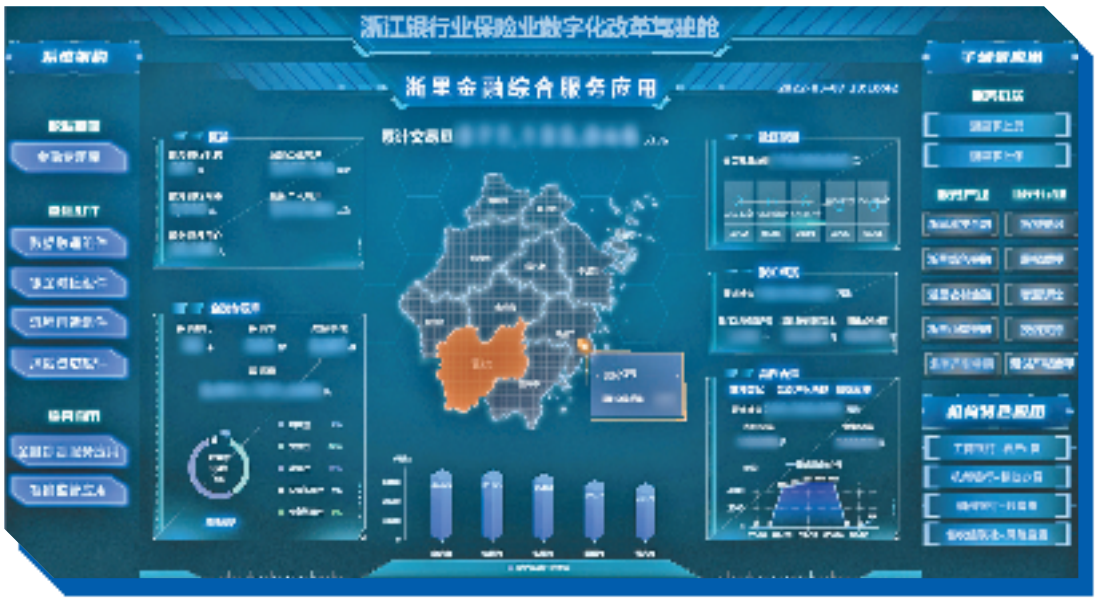
“浙里金融综合服务应用”

滑动数字大屏，入驻台州掌上数字金融平台的银行、保险机构跃然眼前，发布的信贷、保险产品热度排名也一目了然。以办贷需求为切口，台州掌上数字金融平台的建设渐入佳境，已经由单一“掌上办贷”拓展升级为集银行融资、保险保障、创新服务、消费者保护“四专区”“四中心”于一体的金融综合服务平台。