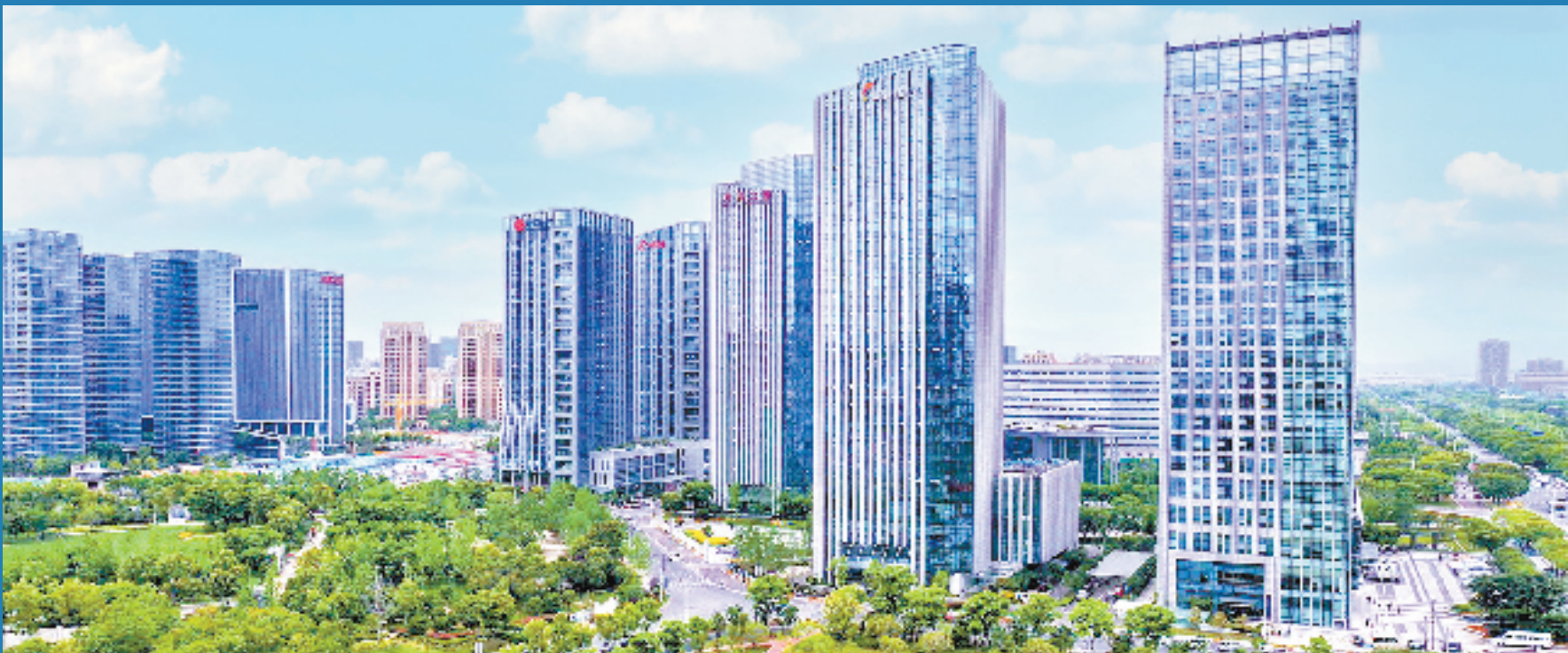
台州市中央商务区

如今，台州正乘“数”而上，稳步推动银行业保险业实现绿色化发展、全面化风控、标准化服务、精细化管理等，推动数字金融变革惠及更多市场主体，全力争创民营小微金改“示范区”，奋力擦亮“重要窗口”的台州小微金融“金名片”。