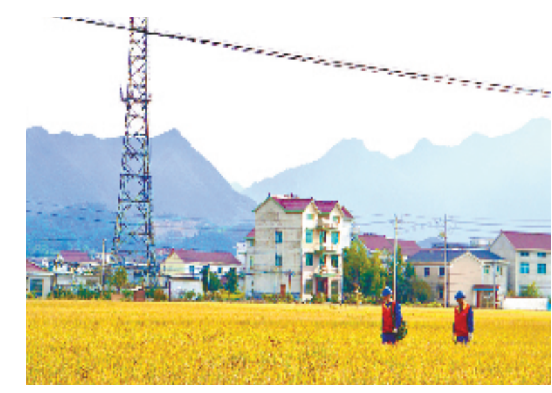
服务小组在田间