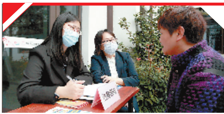
法律服务进社区

临江街道相关负责人说：“通过‘三责三亮三议’活动，不断加强党员干部与群众的沟通，提升了服务群众的能力，让临江街道更有凝聚力，群众更有参与感，助推临江在经济、民生等方面实现高质量发展。”