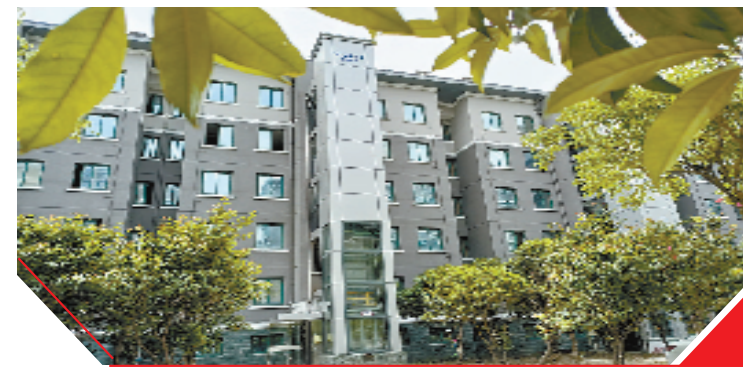
临江佳苑社区加装电梯

记亮相述职的后台，有不少居民留言，希望解决或改善老年人上下楼难的问题。临江佳苑小区建造于2003年，老年居住人口较多，上下楼梯成了小区居民面临的难题，不少居民对加装电梯的意愿十分强烈。