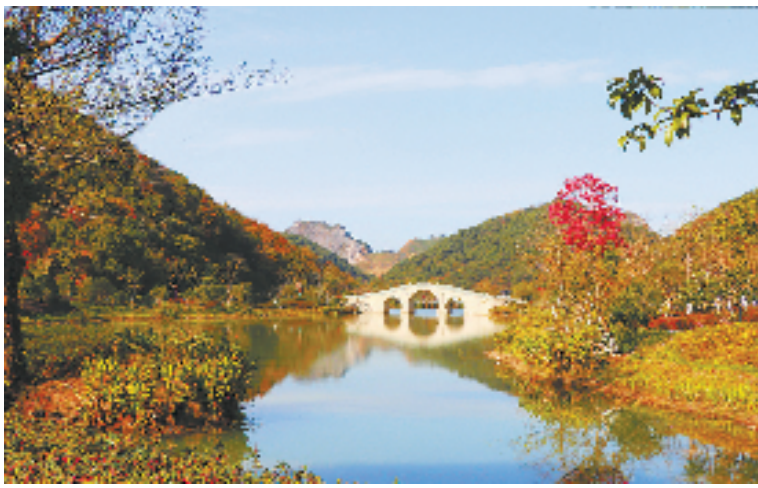
“生态明珠”铜鉴湖

绘新时代“清明上河图”为目标，以“数字消费、数字产业、数字治理”为主线，打造全国数字生活第一街。赋能留下古镇数智产业园，挖掘留下历史文化，以沉浸式数智体验为主线，导入生态链产业项目，再现千年古镇繁荣。赋能铜鉴湖生态建设，在有效推进水资源保护、水污染防治，改善水环境、修复水生态的基础上，深挖湖埠文化遗存，保护和传承历史文化瑰宝，打造“铜鉴湖十二文化节点”，打造之江大地上山清水秀的“生态明珠”。赋能山海文旅大下姜会客厅，山海起新潮，协作启新篇。着力打造“一地三厅”生态文化旅游项目，致力打造红色旅游创新示范第一村。