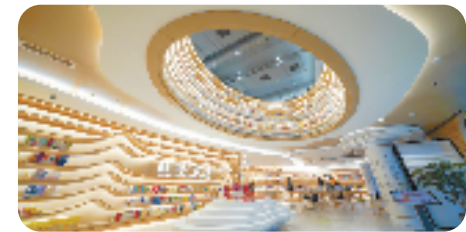
改造后的缙云城市书房