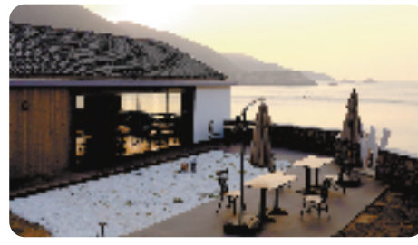
改造后的嵊泗花鸟岛臻镜餐厅