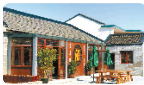
改造后的普陀黄杨尖村无忧酒坊

的重要工作,会同市发改、住建、财政、农业农村、资规、大数据等相关部门组建行动专题小组,并且,将旅游业“微改造、精提升”工作与全域旅游创建、海岛公园、美丽城镇建设、海上花园城打造等工作有机结合,做到信息共享、资源集成、成果叠加。