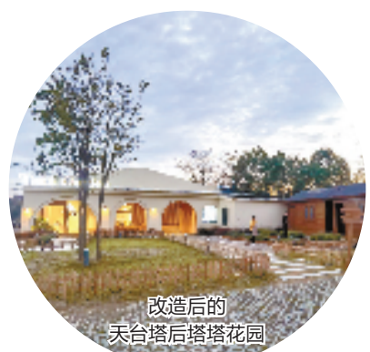
改造后的天台塔后塔塔花园

台州市聚焦做好旅游“微改造”的“绣花”功夫,按照全域覆盖、点面结合、统筹推进、以人为本的原则,全面启动旅游业“微改造、精提升”,推动文旅高质量发展。