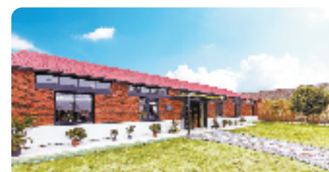
改造后的仙居县田市镇云田植物艺术图书馆

各县市结合文旅产业转型升级的需求,大力开展旅游业“微改造、精提升”工作,以“微改造”牵动“精彩蝶变”,撬动全域旅游产业链的提质升级。仙居县以环神仙居大花园“两区二十村”为改造核心,聚焦“画中有诗”“老屋有喜”“来往有礼”“奋发有为”工程,打造最美风景。天台县多项“微工程”助力乡村逐梦共同富裕,该县泳溪乡通过一幅幅充满浓烈地域色彩和乡土气息的梯田壁画,扮靓了乡村,成为了当地的网红打卡地。临海紫阳街从“小”处着手,通过基础设施改造,店铺升级,环境美化,完善文旅IP,引进知名品牌商入驻等方式,助力台州府城创建国家AAAAA级景区,实现了主客和谐共享。