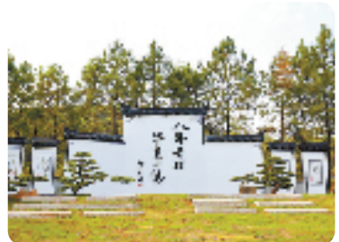
改造后的兰溪市诸葛村

发挥专家作用,社会监督。在今年6月,特邀请浙江师范大学、上海财经大学浙江学院、金华职业技术学院、义乌工商职业技术学院、浙江横店影视职业学院五大院校30位相关领域专家组建市旅游业“微改造、精提升”专家指导团队,参与有关评审活动,开展现场技术指导,“会诊把脉”“传经送宝”。同时,充分激发社