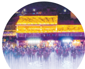
改造后的新昌县梅渚村水幕电影

全域联动抓重点,加强“微改造”试点示范。绍兴市文广旅游局梳理绍兴市旅游业“微改造、精提升”行动试点单位名单,分为景区、度假区、景区城、景区镇、酒店、民宿、文博场馆等12种类型72个试点。各区、县