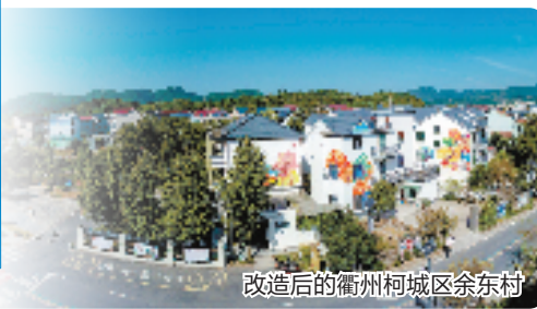
改造后的衢州柯城区余东村

衢州市旅游业“微改造、精提升”排定改造项目 1076 个,已经竣工项目 987 个;今年计划投资 19.9亿元 ,实际完成投资 19.6亿元 ,投资完成率为 98.5% 。发现问题总数 3228 个,解决问题总数 3202 个,问题整改率 99.2% 。