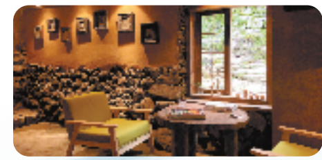
改造后的民宿青鸟咖啡馆