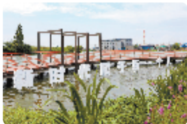
改造后的绍兴齐贤村游步道

全力推进抓机制,共享“微改造”经验。各区、县(市)建立“晾晒”制度,优选一批领先改造项目,推广一批最佳实践案例,营造“比、学、赶、超”的良好氛围。