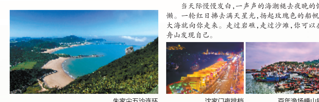
朱家尖沙湾连环 沈家门夜排档 百年渔场嵊山镇

定海古城 定海古城遗址，是中国著名的海岛文化名城。古城内保存有明清时期的中大街、西大街、东大街、柴水弄、留方路等历史街区，分布着许多年代久远的古迹。如今，诸如花艺吧、咖啡馆、民宿等等的进驻，也为古城带来了小清新的范儿。 后记 当天慢慢慢慢白，一声声的海潮褪去夜晚的慵懒。一轮红日拂去满天星光，扬起玫瑰色的帆帆，大海向你走来。走过岩礁，走过沙滩，你可以在舟山发现自己。