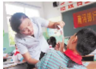
南浔银行送金融知识进校园