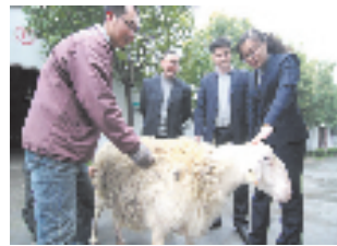
客户经理考察某家庭农场成熟种羊