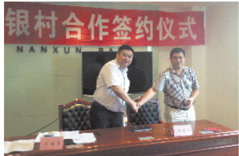
积极推进银村战略合作