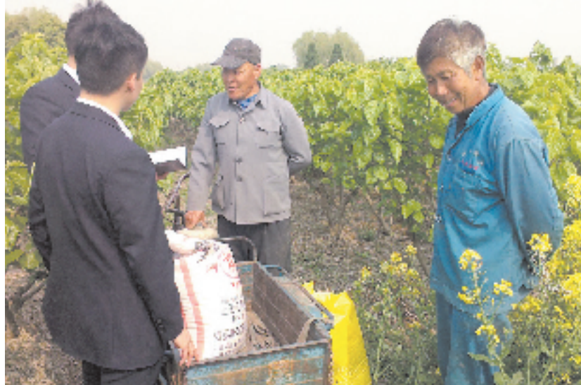
深入田间地头听取群众意见

目前，南浔银行资产总额超过234亿元，所有者权益达到26.3亿元，分别比4年前增加了60.6%和68.9%。各项存款余额突破400亿元，各项贷款余额达112亿元，存款和贷款在湖州市均占到半壁江山。4年来累计实现利润17亿元，实缴税收超过7亿元，并先后荣获了第三届全国“十佳农商行”、省政府颁发的“金融机构支持浙江中小企业发展优秀奖”、浙江银行业提升农村金融服务先进集体、浙江农信系统十强支农支小单位等荣誉。