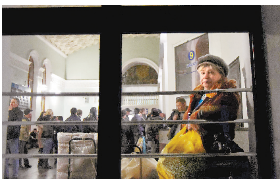
12月27日,乌克兰暂时切断乌内地与克里米亚半岛之间的交通之后,一名妇女在克里米亚辛菲罗波尔火车站候车。

俄罗斯和乌克兰方面都没有公开煤电供应协议的细节。科扎克告诉俄罗斯24小时新闻电视台记者,