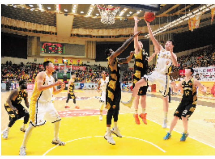
在28日晚的CBA联赛中,浙江广厦男篮坐镇主场,以116比105逆转战胜山东队。在另一场比赛中,浙江稠州银行男篮在义乌,以104比110不敌前来挑战的青岛队。