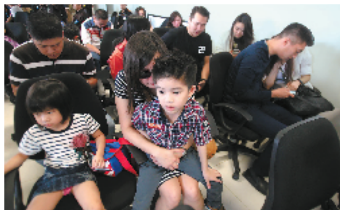
12月28日,失联的马来西亚的亚洲航空公司QZ8501航班的乘客亲友在印度尼西亚泗水朱安达国际机场等候消息。