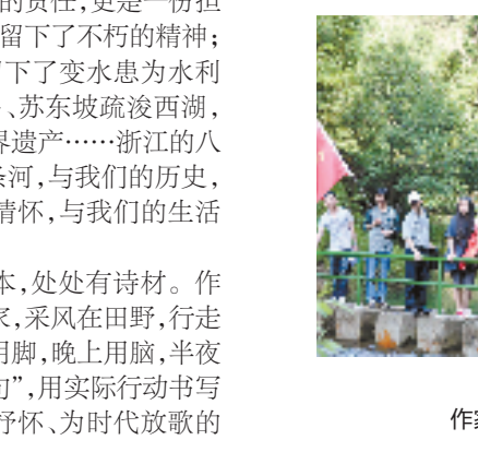
作家、诗人钱塘江抒怀。