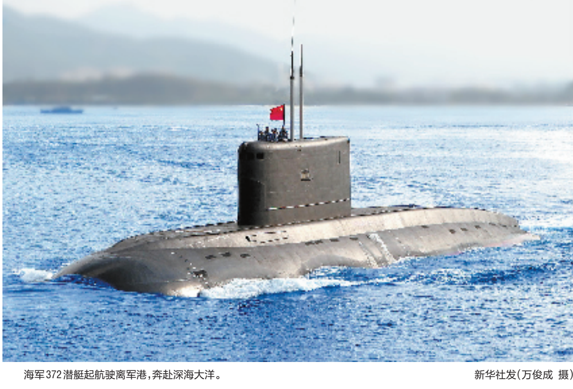
海军372潜艇起航驶离军港,奔赴深海洋。

范长龙强调,全军和武警部队要广泛开展向372潜艇官兵群体学习活动,学习他们听党指挥的坚定信念,强化军魂意识,一切行动听从党中央、中央军委和习主席指挥;学习他们矢志强军的使命担当,狠抓训练兵备,把能打仗、打胜仗要求贯彻到部队建设各方面、全过程;学习他们精武强能的过硬本领,熟练掌握