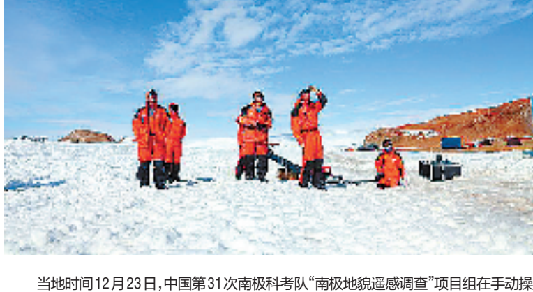
当地时间12月23日,中国第31次南极科考队“南极地貌遥感调查”项目组在手动操作无人机飞行。这是我国首次在南极地区使用无人机进行遥感测绘作业。