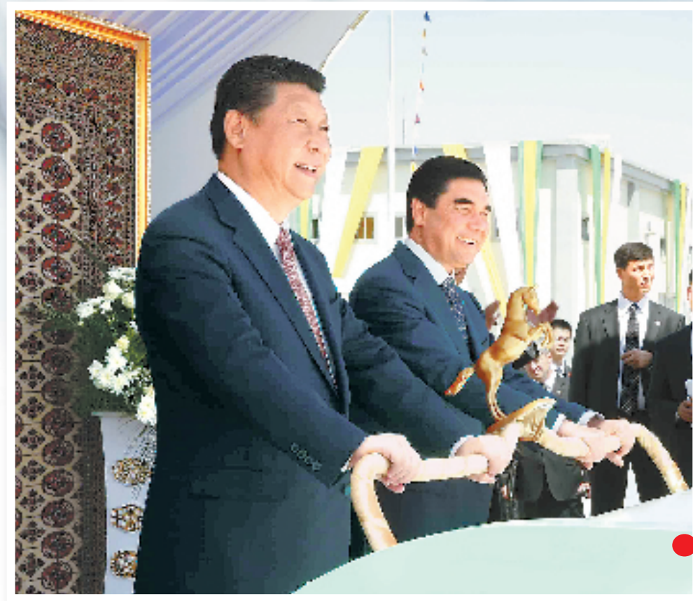
习近平和土库曼斯坦总统别尔德穆哈梅多夫共同出席“复兴”气田一期工程竣工投产仪式。“复兴”气田是世界第二大单体气田,目前探明储量4万亿至6万亿立方米。该气田是土库曼斯坦天然气对外出口重要基地,也是土库曼斯坦重要气源地。

中国商务部专家介绍,“21世纪海上丝绸之路”面向所有国家,中国从3个辐射起点联通其他地区,摩洛哥海岸向南北美洲辐射;巴基斯坦的瓜达尔港连接西亚、南亚、非洲东部;以台湾为核心的我国东南沿海向东北亚、东南亚和太平洋地区辐射。