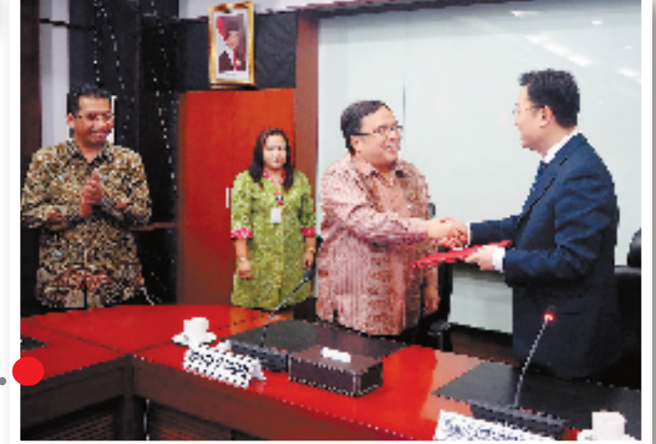
10月底,中国提出筹建亚洲基础设施投资银行的倡议并得到了广泛支持。亚投行犹如一个巨大的“血库”,为亚洲各国的发展和建设提供坚强后盾。图为11月25日,印尼成为亚投行第22个意向创始成员国。