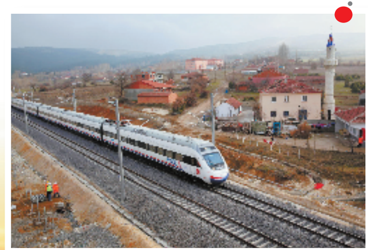
7月25日,由中国企业参与建设的连接土耳其首都安卡拉和土最大城市伊斯坦布尔的高速铁路二期工程顺利实现通车。这是试验列车通过位于土耳其博斯普鲁斯湾附近的村庄。