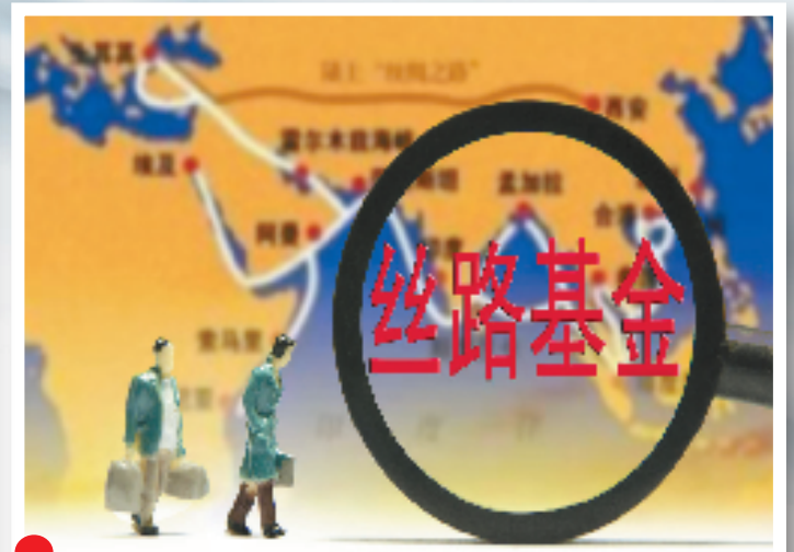
在北京APEC会议上,习近平主席宣布,中国出资400亿美元成立丝路基金,为“一带一路”沿线国家基础设施建设、资源开发、产业合作等有关项目提供投融资支持。