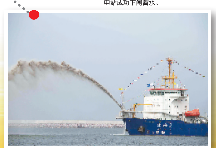
斯里兰卡科伦坡南港是斯最大的外商投资项目之一。项目完工后,将大大提升科伦坡港口的吞吐能力。科伦坡南港集装箱码头项目总投资超过5亿美元,由中国招商局国际有限公司主导融资、设计、建造、运营及管理,特许经营期为35年。