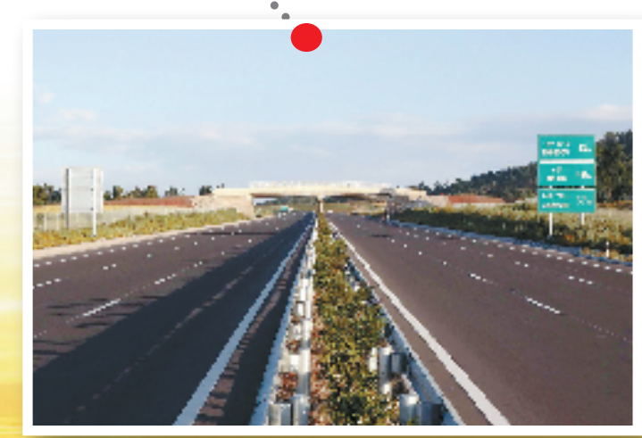
这是由中国交通建设集团公司承建的西亚的巴阿阿达玛高速公路,是埃塞俄比亚历史上第一条高速公路。非洲当地人亲切地称呼这些由中国企业建设的道路为“美丽中国路”。