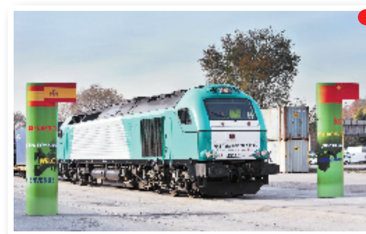
首趟“义新欧”中欧班列于11月18日从中国义乌出发,历时21天,最终抵达西班牙马德里。这条铁路线全长13000多公里,是目前所有中欧班列中最长的一条。其行程贯穿丝绸之路经济带,为中国小商品出口欧洲开辟了一条全新的安全、高效、便捷物流通道。