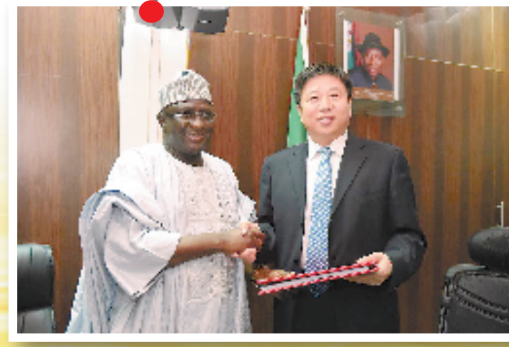
11月19日,中国铁建中非建设有限公司与尼日利亚交通部在尼日利亚首都阿布贾正式签署沿海铁路项目商务合同,合同总金额119.7亿美元。这是目前中国对外工程承包历史上单体合同金额最大项目。