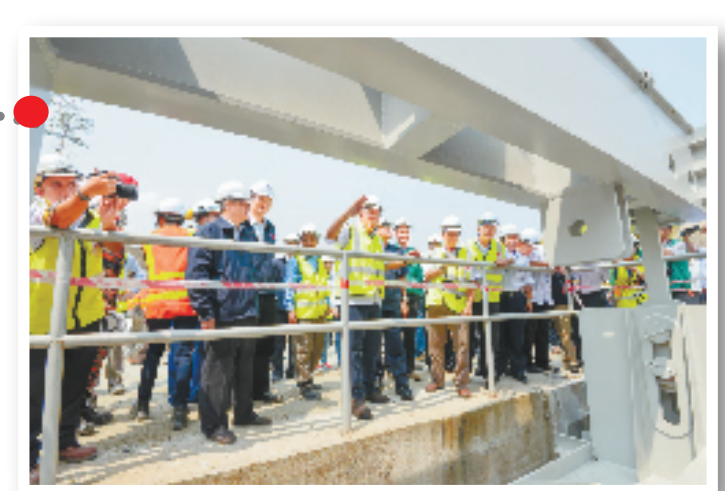
10月1日,由中国水利水运第七工程局有限公司承建的马来西亚胡鲁水电站成功下闸蓄水。