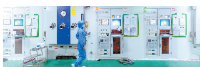
科汀光学医用镀膜车间

余杭生物医药高新园区产业发展的“五年行动”目标是:到2020年,初步建成长三角最大的现代医疗设备高新园区之一。在功能集聚上,高新园区完成省医疗器械审评中心、省医疗器械检验院余杭分院、省食药监局行政审批受理分中心、创新药物早期成药性评价公共服务平台、企业研发资源共享平台等五大功能性平台建设。在产值规模上,高新园区实现产值200亿元,其中医疗器械占60%~70%,培育一批1亿元企业和10亿元企业。